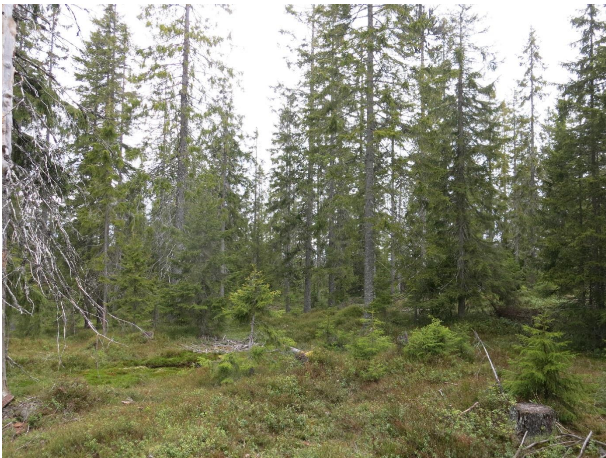
Figur 5. Et mindre område på Sølvjernshøgda ble gjennomhogd på slutten av 90-tallet, men bærer fortsatt preg av å være eldre flersjiktet skog.

Skogen sør for Skotjernsbekken skiller seg markert ut ved at dette er yngre tett planta granskog i hogstklasse III, (sør for Vesle Skotjernet-se fig. 13), eller halvgammel/ynge skog (avgrenset som F14 i hogstklasse III i bestandskart fra rundt 2005). Den bærer preg av å være «restskog» etter harde gjennomhogster/fltahogst med enkelte spredte noe eldre furutrær og yngre gran- og bjørkeskog under. I tillegg er skogen en del forsumpet noe som har redusert tilveksten etter hogst. Unntaket er et mindre bestand (nr.863) mellom Vesle Skotjernet og Skotjernet som er eldre naturskog. Vest for Store Snellingen er selve kantsona mot vannet urørt av gjennomhogster som ble gjennomført på slutten av 90-tallet. Her dominerer gran i midlere dimensjoner med en del grov furu i øvre sjikt. Ellers er grana i stor grad hogd mens furua er spart sammen med de minste grantrærne. Mye myr i disse traktene medfører at skogbildet også til dels er naturlig glissent. I nord mot Vesle Snellingen er det eldre blåbærgranskog som ikke/i liten grad er gjennomhogd i nyere tid.