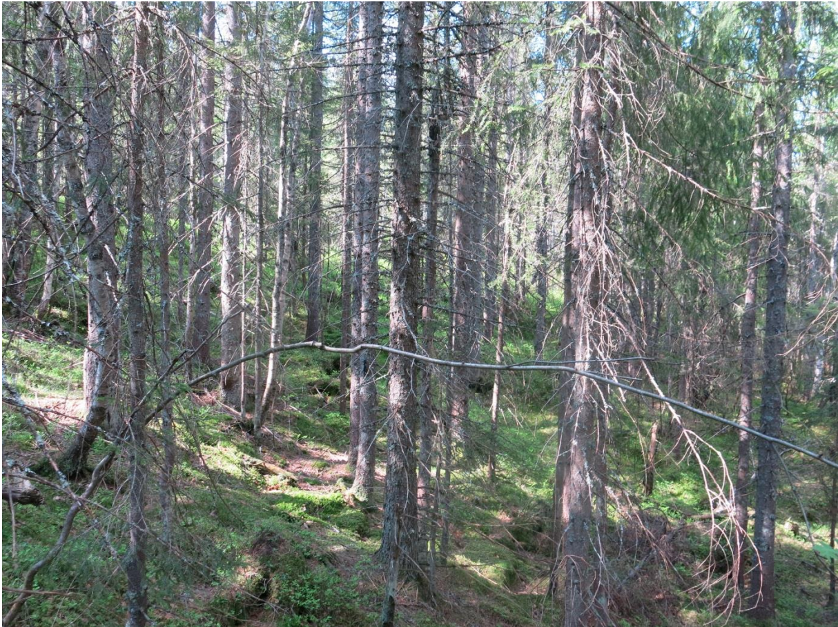
Figur 11. Tett III-skog på Lunnarsiden som gjerne kan utelates.

Vest for Snellingen er avgrensningen i all hovedsak god, ved at det i sør og vest grenser mot hogstflater og ungsog. Rundt Tranbærtjern grenser det i hovedsak mot eldre skog, men denne er delvis på en annen eiendom.