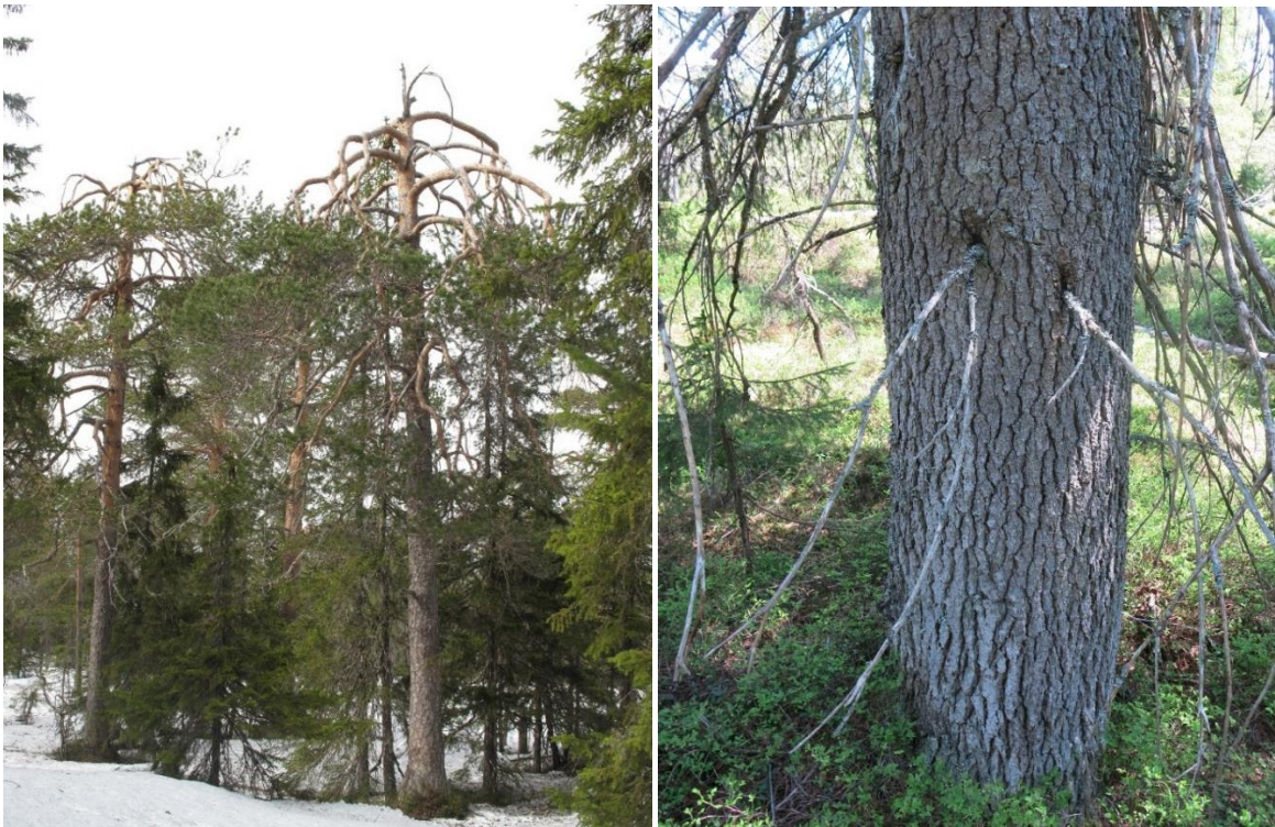
Figur 8. Furu finnes helst i tilknytning til myrer og koller, her fra Lunner. Ofte er disse tiurbeita og trolig finnes flere leiker innenfor området i begge kommuner. Til høyre ses ei virkelig gammel gran med grov sprekkebark og nedlutende greiner anslått til å være >250 år gammel. Den står nær ei myr sørvest for Kule tjerna.