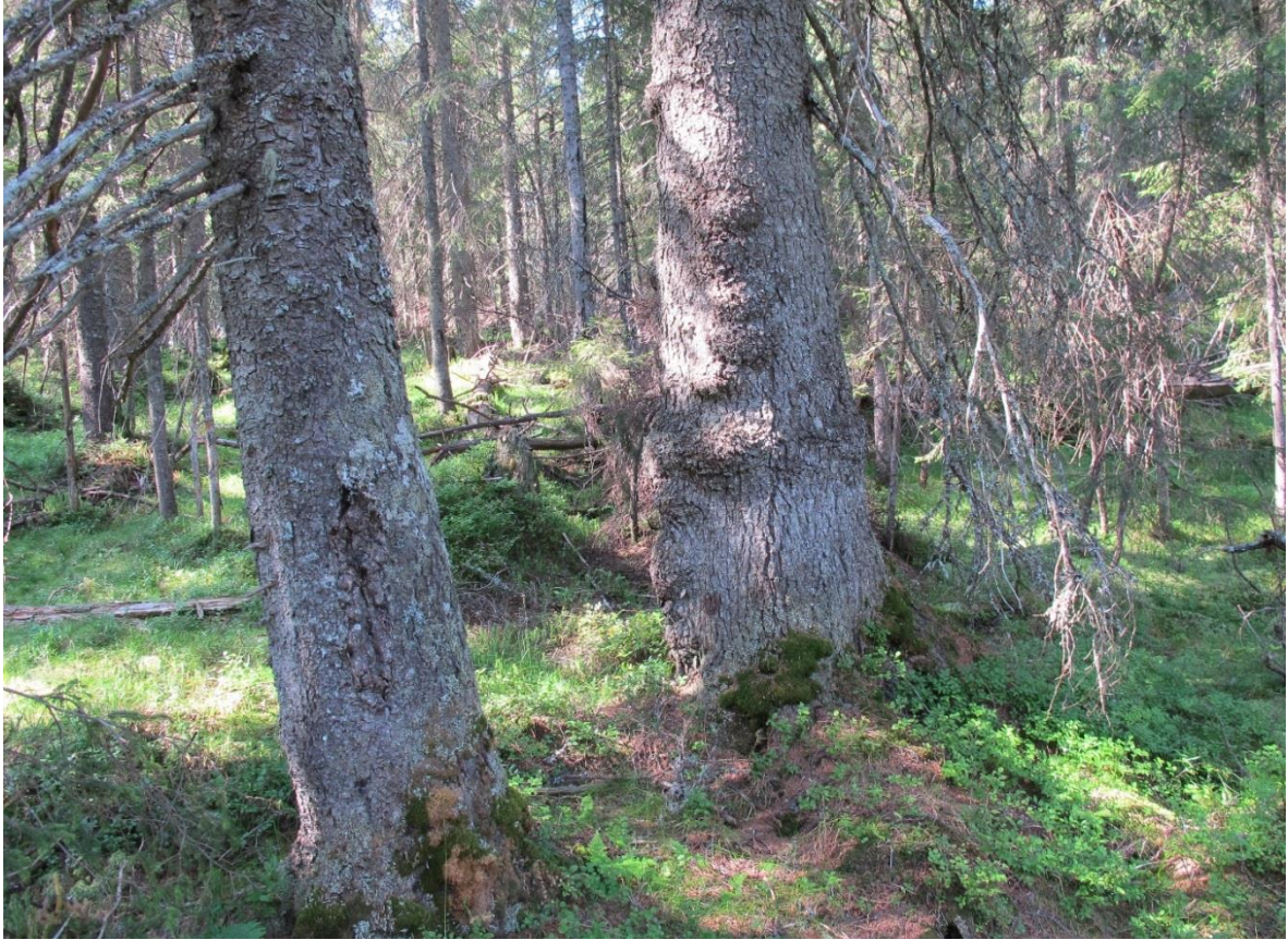
Figur 7. Også i Akershus delen finnes enkelte partier med grov gammelskog, her fra kjerneområdet Rundhaug. Skogen i bakgrunnen er klart yngre.