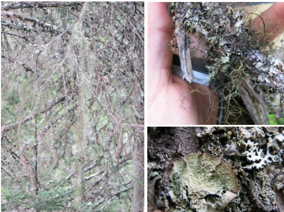
Figur 101. Lokalteten har med sin kombinasjon av suboseanisk klima og gammel granskog, forekomster av krevende arter. Til venstre ses huldrestri i fra Skotjernshaugen. Nede til høyre ses skrukkelav som i all hovedsak finnes langs kysten fra Rogaland til Nordland, men som også finnes i gammel granskog i Nordmarka-Totenåsen. Øverst til høyre ses kort trollskjegg som både vokser på gamle grantrær, men også på fuktige bergvegger.