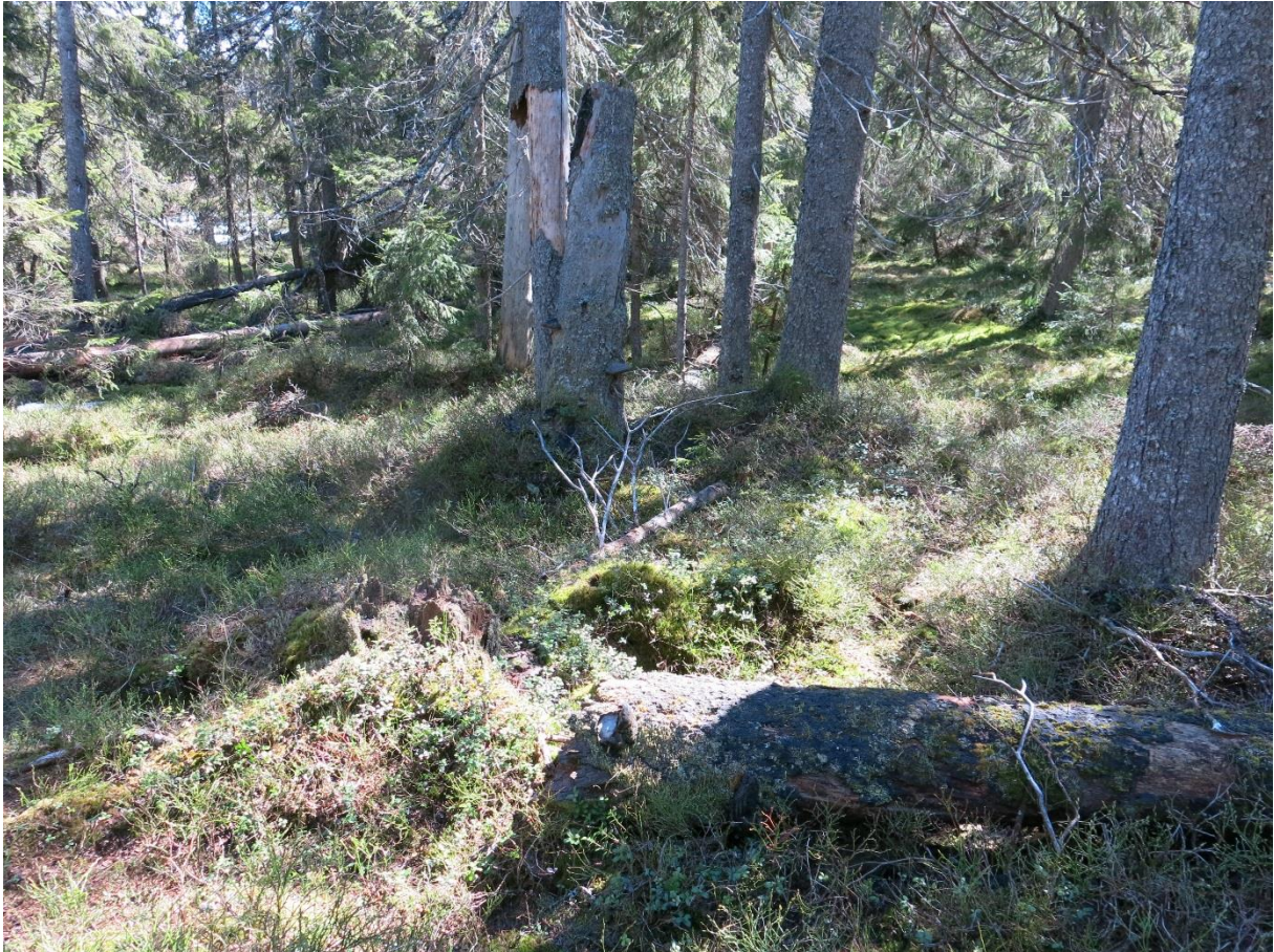
Figur 3. Gammel naturskog ved tjernet øst for Sølvjernshøgda med spredt dødved i alle nedbrytningsstadier.