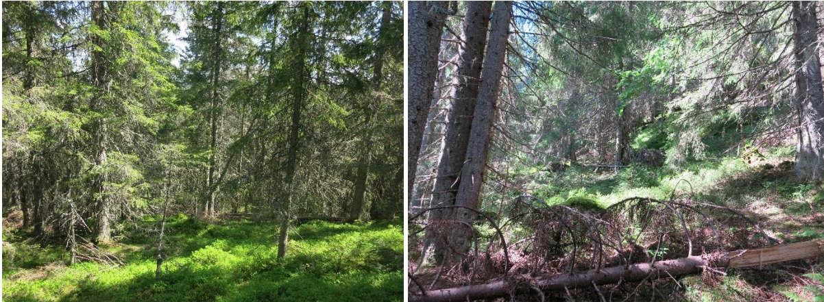
Figur 12. Til venstre ses søndre deler av østhellinga av kullen 612 moh. øst for Bjønnåtedalen. Til høyre ses eldre skog vest for Erikspalten (vest for Torestjernet).

Skogen i nedre/midtre deler av den nordøstvendte lisen fra kulle 612 moh. øst for Bjønnåtedalen og ned til bekkedalen som går nordvest/sørøst, er halvgammel kulturskog. Det samme er noe skog umiddelbart nord for samme bekkedal. Øvre deler har mer naturskogsnær skog eller er naturskog. Det samme gjelder lisen vest for Torestjernet selv om nordre deler av lisen har kulturskogspreget. En del av kulturskogen har begynt å produsere stående og liggende dødved, og vil innen rimelig kort tid begynne å få en mer åpen og naturlig skogstruktur. Skogen er delvis tett, men ikke så tett at blåbær er konkurrert ut. Det anbefales at det alternative avgrensingsforslaget inkluderes. Dette da: