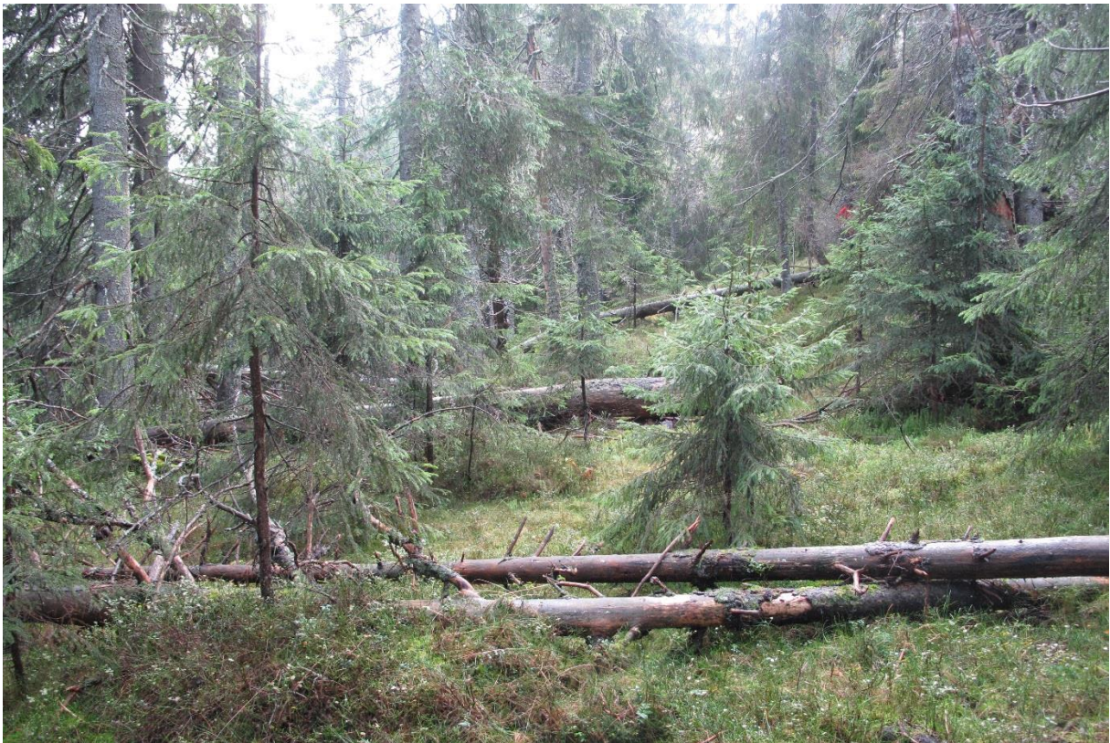
Figur 4. Enkelte mer produktive søkk har delvis urskogsstrukturer som i kjerneområdet «Fjellsjøen vest».