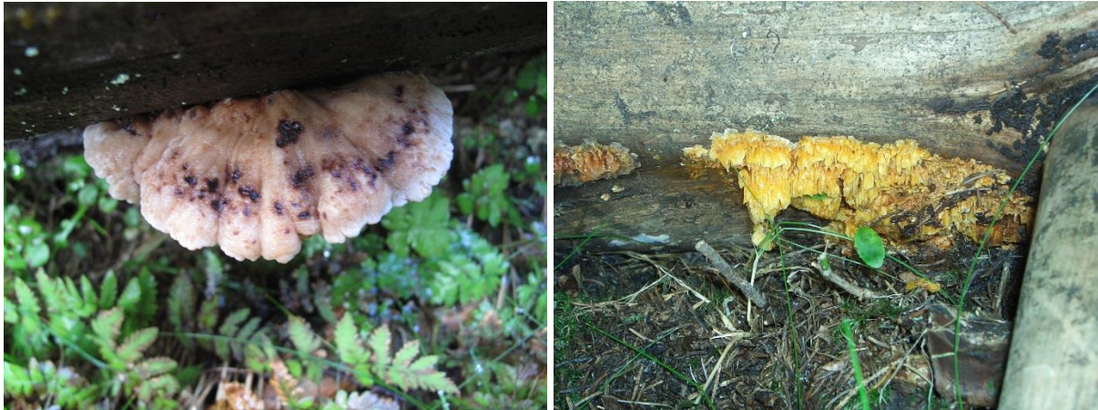
Figur 9. Lappkjute (til venstre) har i deler av området rike forekomster. Storpora flammeskjute ble i 2006 funnet på ei låg.

dette er blant de aller viktigste områdene for arten i Norge. Det er her gjort en rekke/flere funn av de nær trua (NT) artene svartsoneskjute, rynkeskinn og rosenkjute og den sårbare klengeskjute (VU) og pastellkjute (EN) er begge funnet én gang. I tillegg er det gjort mange funn av signalartene for eldre skog; duftskinn, granrustkjute, hyllekjute, granstokkjute, praktbarksopp og kjøttkjute. Det mest spesielle funn er storporet flammeskjute som er kritisk trua (CR).