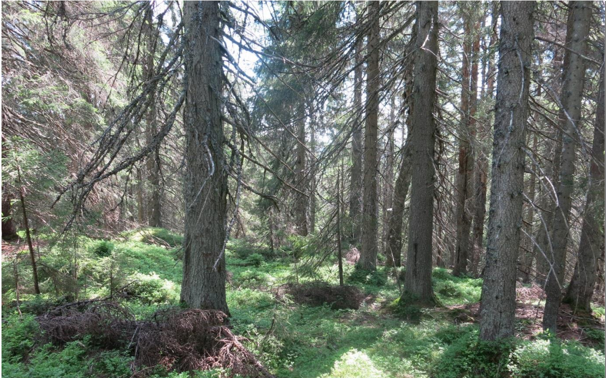
Figur 6. Typisk skogstruktur i Nannestad. I hovedsak nokså tett ensaldret eldre skog i eldre optimalfase. Det er i det senere blitt dannet en del stående dødved, og området vil innen rimelig kort tid får et mer åpent, flersjikt skogbilde med mer dødved. Stående dødved etter selvtynninger er allerede dannet en del steder. Legg merke til de ferske toppbrekkene.

utvikla naturskogsstrukturer og har ikke blitt like hard hogd. Ved Rundhaug er det et flere hundre dekar stort område med yngre planta kulturskog (se diskusjoner om avgrensning). Skogen er i Akershus generelt ikke like grovvokst som på Lunner-siden, noe som skyldes at den er yngre og at tresjiktet er tettere. Men skogen vil i framtiden ofte kunne oppnå store dimensjoner pga. høyt innslag av mindre lisider med god drenering og dermed nokså god tilgang på plantenæringsstoffer. På Høgbrenna ble det funnet sotmerker i ei furu, og for lang tid siden har det derfor trolig vært en mindre skogbrann her. Ved Torestjernet ble sett ei trolig gammel brannlyre i ei gammel furu, men skogbrann har ikke vært en viktig økologisk faktor i området de siste minimum 500 årene etter alder på grantrærne og lægre å dømme.