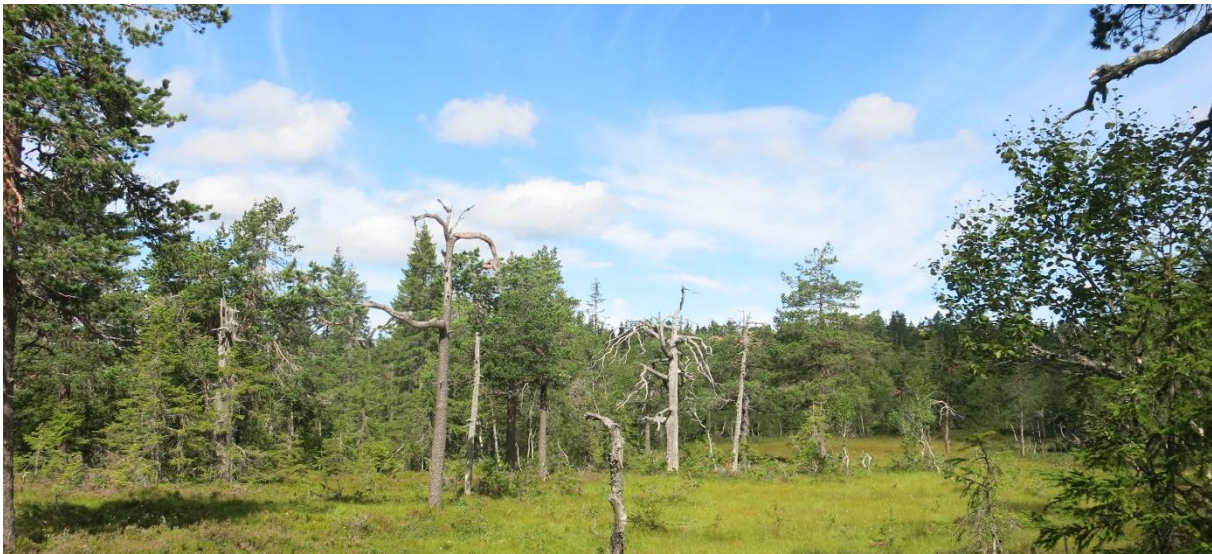
Figur 2. Enkelte steder finnes gammel furugadd i tilknytning til myrer, noe som er uvanlig i regionen pga. mye friluftsliv. Her fra søndre deler av Bjønnåtedalen,