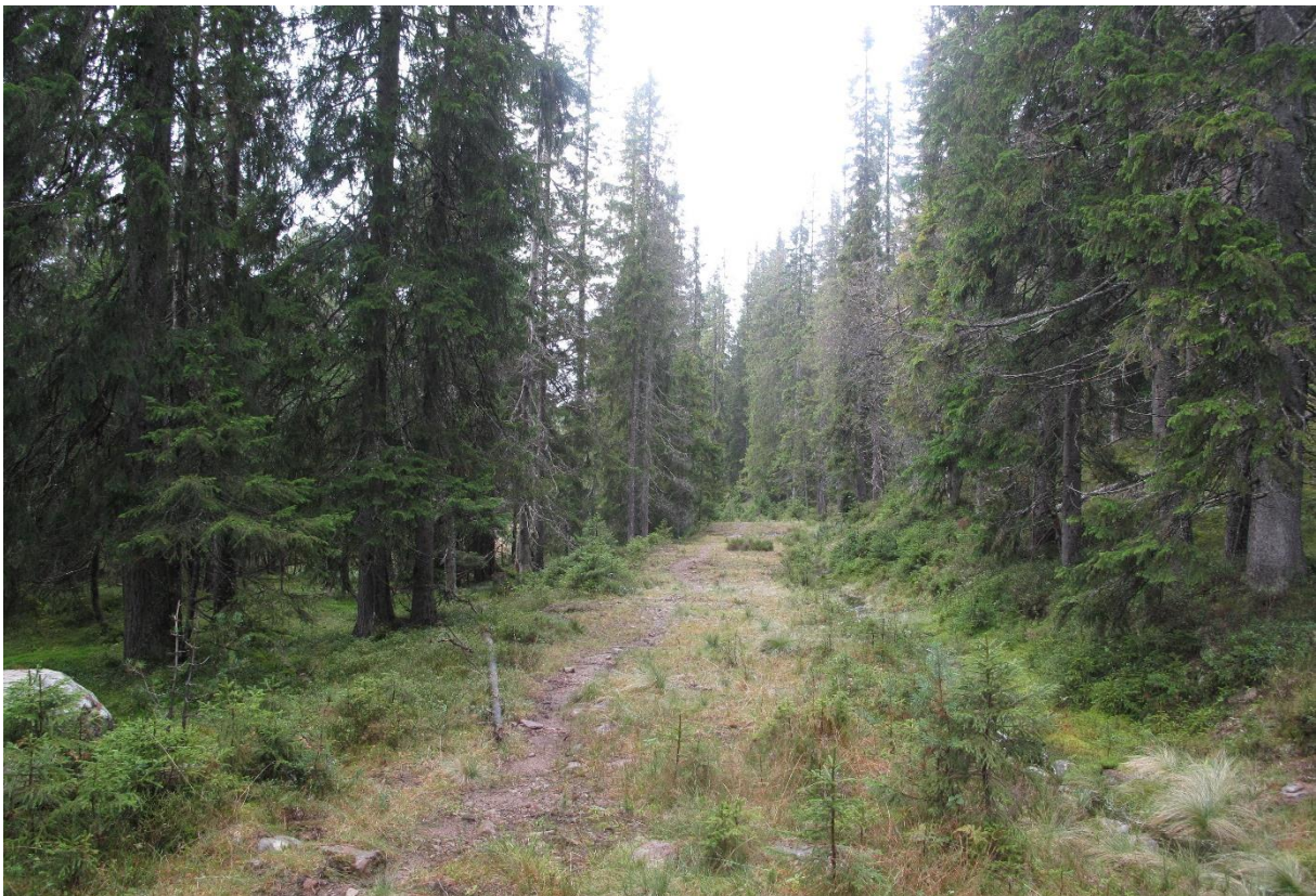
Figur 14. En begynnelende gjenvoksende traktorvei går inn i området i et par hundre meter i nordvest. Forekomsten av storporet flammekjuka ligger ikke langt fra traktorveien, og skogen på vestsiden har også en viktig funksjon som buffer mot denne.