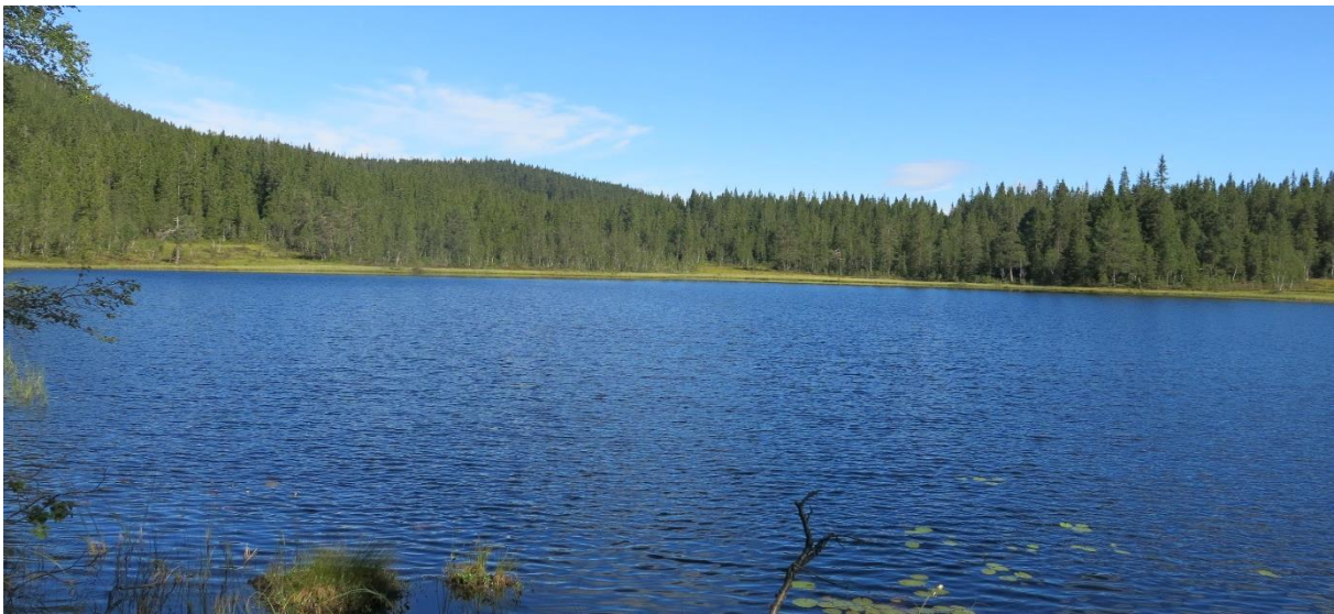
Figur 1. Torestjernet sett fra sør. Den flate kollen i nord (midt i bildet) er Rundhaug, mens deler av brattliene ned fra Skotjernfjellet ses i vest. Rundt hele tjernet er det et intakt skogbilde.

Lokaliteten ligger 420-621 m.o.h. med mesteparten av arealet 5-600 m.o.h. Arealet vest og sør for Skotjernfjellet NR i Lunner har rolig terreng som i nord avbrytes av enkelte mindre nedskårne søkk samt generelt flere mindre myrer. Vest for Snellingsrøysa NR i Lunner er terrenget flatt mens skrenten fra Storvasshaugen til Store Snellingen er svært bratt. Terrenget i Akershus sør og sørøst for Skotjernet består av en rekke nord/sør- eller øst/vest-gående bratte daldrag med tilhørende bratte lisider. Mellom disse er det større nokså flate rygger. Øst for Skotjernfjellet NR er det bratte østvendte lisider som flater av mot Kuletjerna og Torestjernet. I nord ved Svartputt er det ei større «gryte» avgrenset av Rundhaug, Høgbrenna og Storvasshaugen. Det er få bekker i området og Skotjernbekken er trolig den største. Små og halvstore myrer finnes spredt i helst flatere terreng, og de største myrene ligger vest for Store Snellingen samt vest for Torestjernet og vest for Skotjernfjellet NR. Vann og tjern i området er Skotjernet, Vesle Skotjernet, Svartputt, Store og Vesle Snellingen.