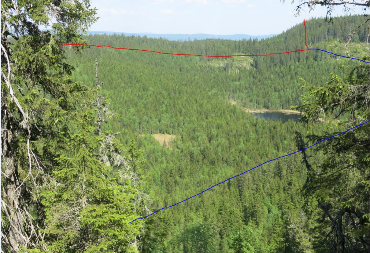
Figur 13. Svartputt ses med eldre skog i hovedsak innenfor Snellingsrøysene NR i bakgrunnen. Rød strek viser omlag avgrensning av dette reservatet, mens blå stek viser avgrensning av utvidelsen uten ungsbogen rundt Svartputt. Bildet er tatt i fra sørvest.