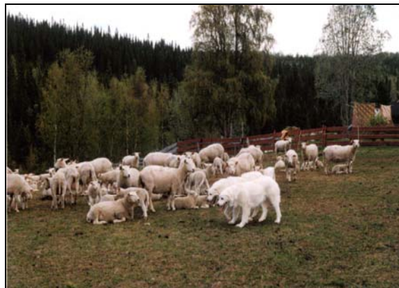
Vokterhunder brukt på inngjerdet beite.

vokterhunder i arbeid skal merkes med informasjonsskilt.