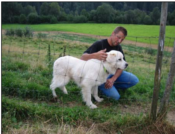
Sosialisering på folk er viktig.

Det er et tredve-talls raser som går under betegnelsen vokterhunder. Spesielt under norske forhold, med bl.a. hundeloven, lov om friluftslivet og skadeerstatningsloven å forholde seg til, er det viktig å satse på hunderaser som ikke har for skarpt temperament. Pyrenèerhunden er den rasen med færrest konflikter overfor folk, andre hunder og bufe, og kan anbefales som en god nybegynnerrase. Anatolske gjeterhunder (akbash og karabash) anbefales ikke, da disse rasene kan ha et utpreget vokterinstinkt og vokte sterkt også mot folk. Temperamentet varierer imidlertid både innen og mellom raser, og er foruten det genetiske grunnlaget avhengig av styrken på ditt lederskap, sosialisering og miljøtrening for øvrig. Aggressive individer må ikke benyttes i Norge.