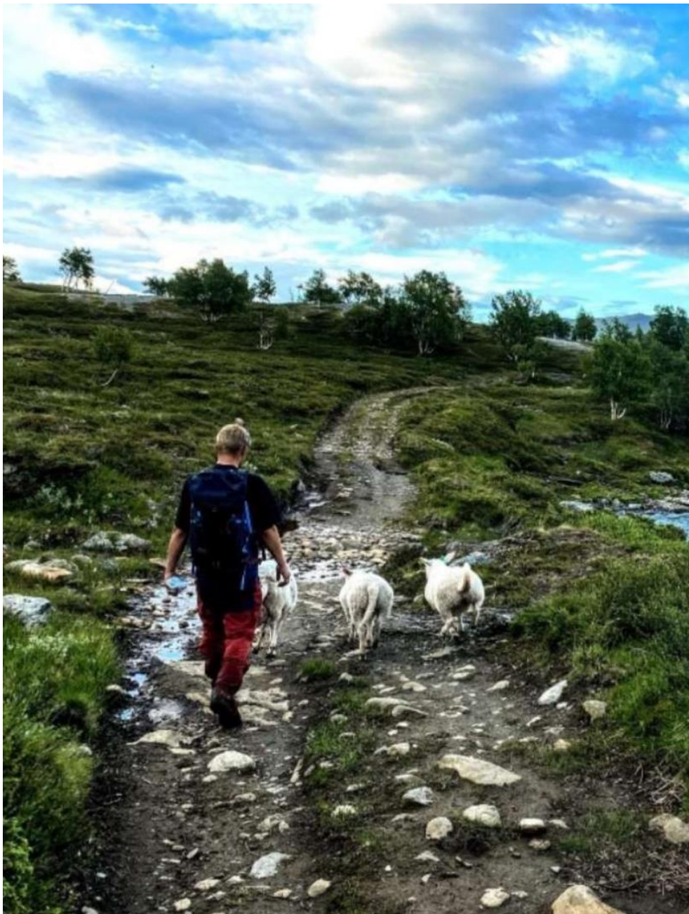
Køyreråket frå Russtangen til Russvassosen er mykje nytta i samband med utøving av stadbunden næring som fiske, beiting og tamreindrift.