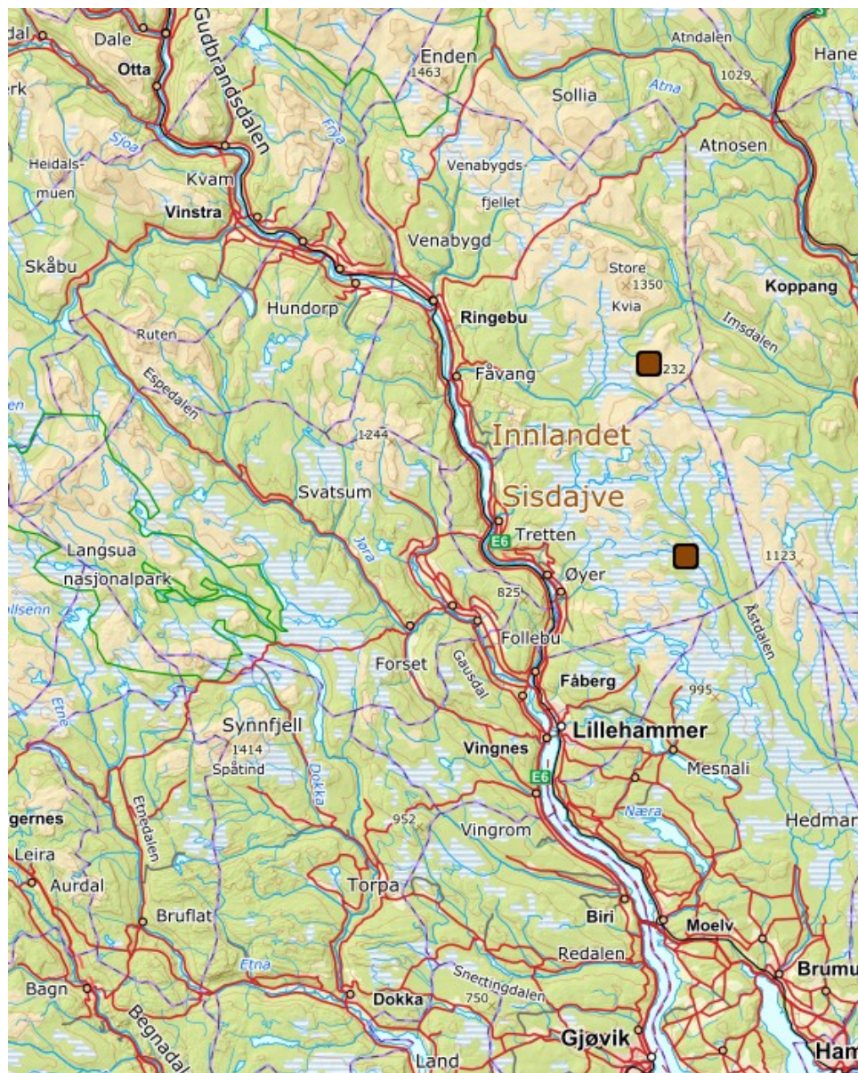
Figur 2: De brune punktene viser antatt og dokumenterte skader på sau forårsaket av brunbjørn.

Det er ingen dokumenterte skader på storfe og tamrein forårsaket av bjørn i Oppland. Enkelte år forekommer det skader forårsaket av bjørn på bikuber, slik som det hendte i Gran i 2023.