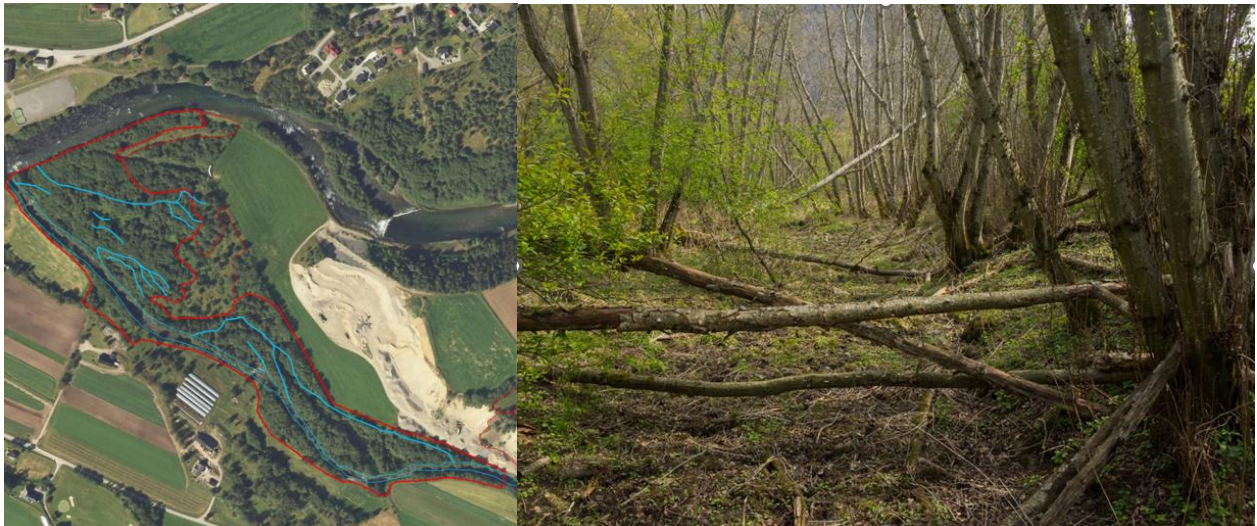
Flaumløp er viste med blå strek.