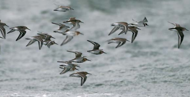
MYRSNIPE er en vader, som gjerne observeres flyvende i flokk.