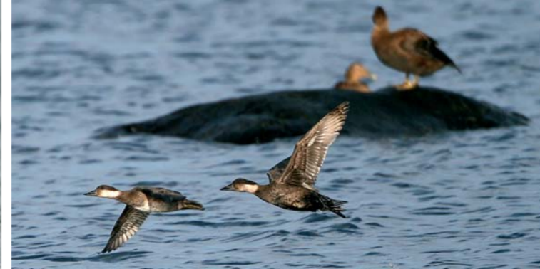
SVARTAND er en dykkand. I bakgrunn sees en ærfugl hunn.