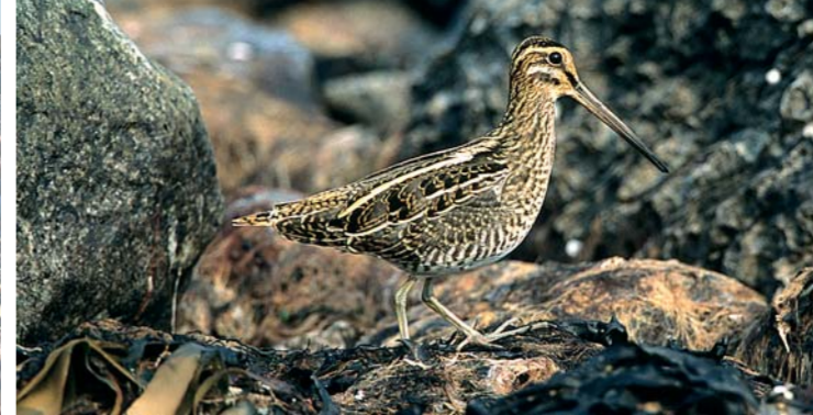
ENKELTBEEKASINEN kan observeres på næringsøk i fjæra.hunn. KVINAND er en dykkand som overvintrer i fuglefredningsområdet.