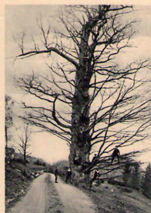
Et gammelt postkort viser at eika har vært stor lenge. ▲

Kjoseeika ble fredet 23. mars 1917, som den første naturfredningen etter naturvernlovgivningen i Vestfold.