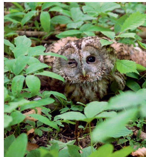
En ung kattugle i Hortenskogen. ▲

◀ Tivolilinden er administrativt fredet, og står rett nord for grensen til Karljohansvern plante- og dyrefredningsområde. De grønne bladene i treetts krone tilhører den vintergrønne mistelteinen.