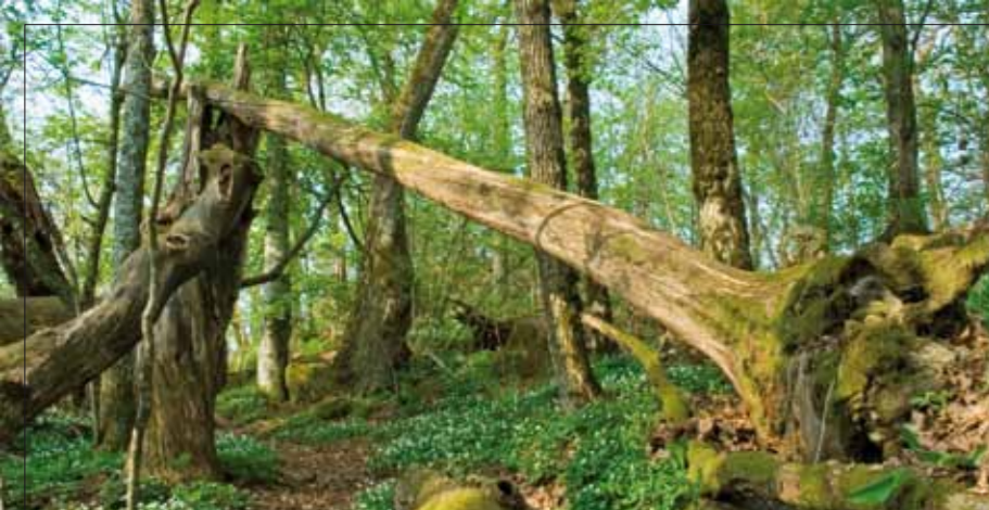
Eikeskogen ved Ratsebu Høy har et urørt preg.