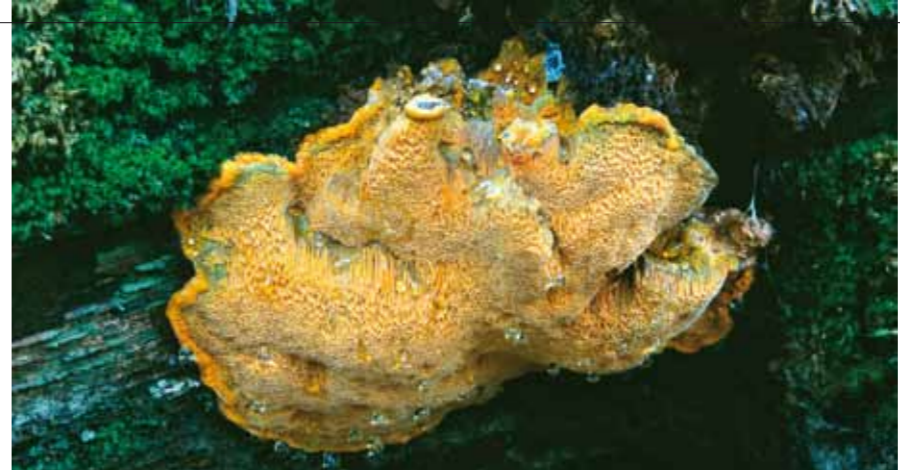
SAFRANKJUKE på undersiden av grov eikestamme.