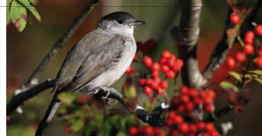
Sangeren MUNK (hann), en karakterart i rike edelløvsoger.