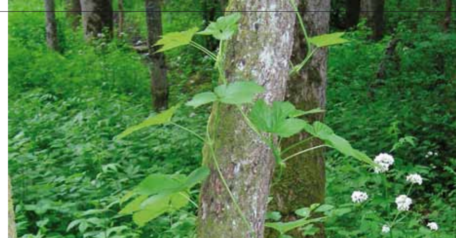
HUMLE klatrer i en ung svartor.