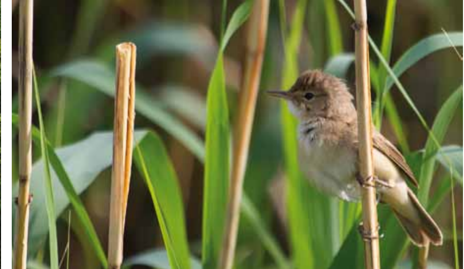
RØRSANGER hekker i takrørskogen