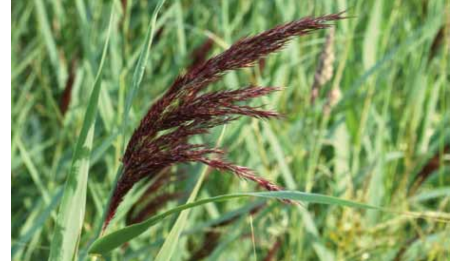
TAKRØR kan bli over 3 meter høyt og er typisk for reservatet