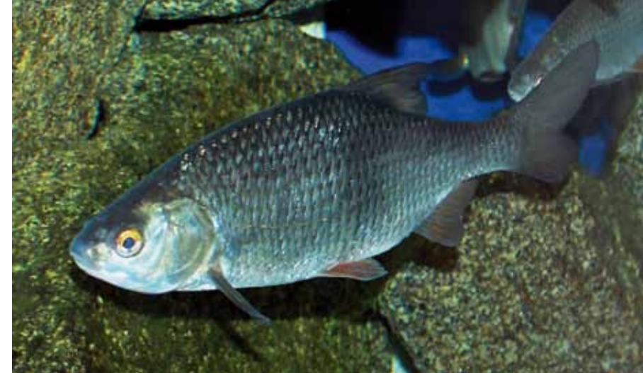
MORT er en vanlig karpefisk i Borrevannet