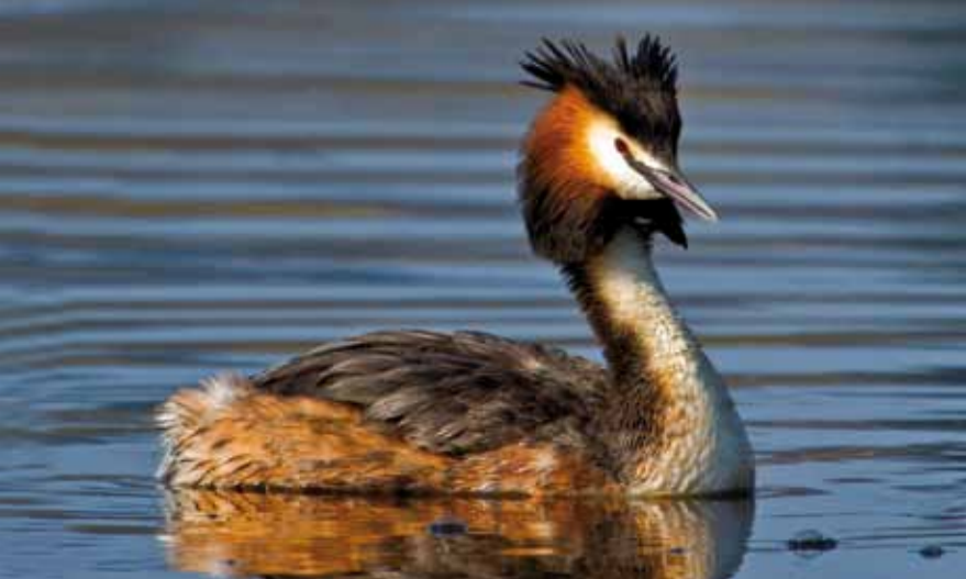
TOPPDYKKER bygger ofte flytende reir