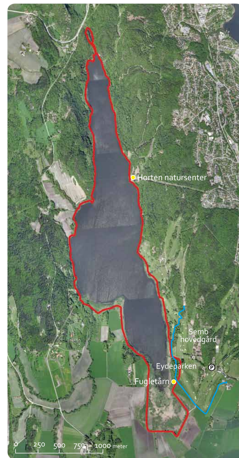
Tilslagsnummer: Statens Kartverk, Måst 12002-R1274/54, Tilslagsnummer GEOVEKST: GV-L-0700.