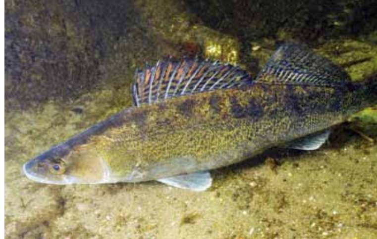
GJØRS tilhører abborfamilien og er en god matfisk