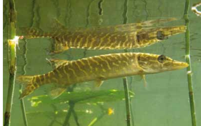
GJEDDE er en glupsk rovfisk med skarpe tenner