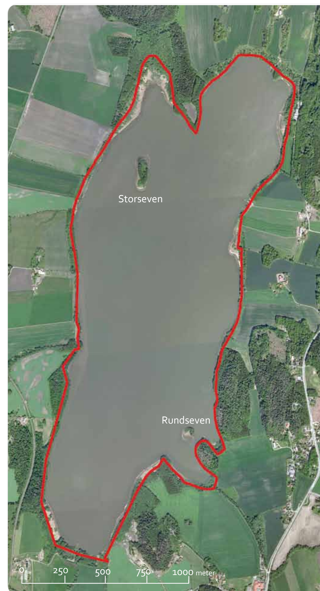
Kartgrunnlag: Tillatelsesnummer: Statens kartverk, Måst 12002-R27254, Tillatelsesnummer: GEOVEKST.GV-1-07900.