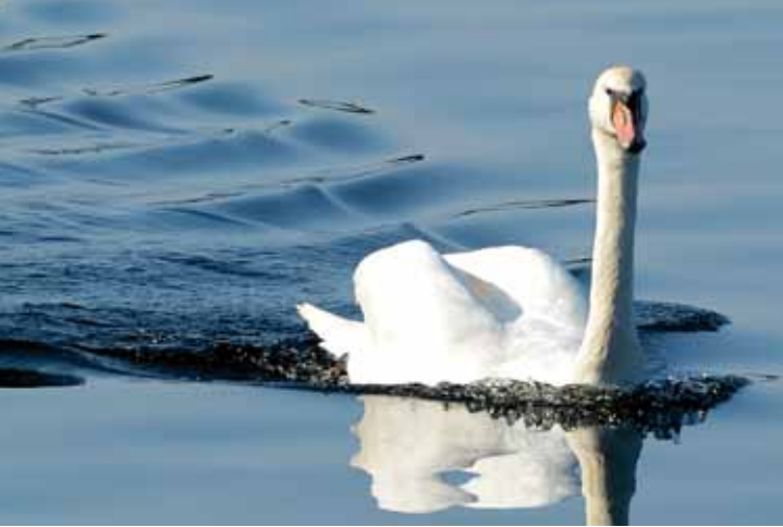
KNOPPSVANE hekker på Storseven og Rundseven