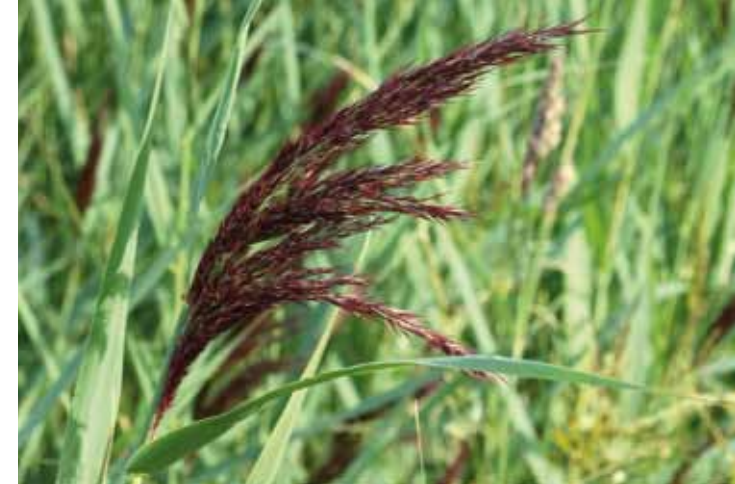
Gresset TAKRØR omkranser reservatet