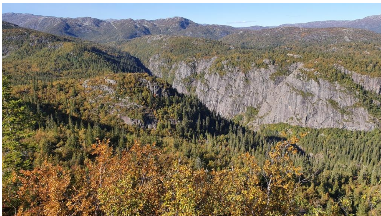
Utsyn frå Nystøylnuten over Smogåjuvet og Ånefjell.