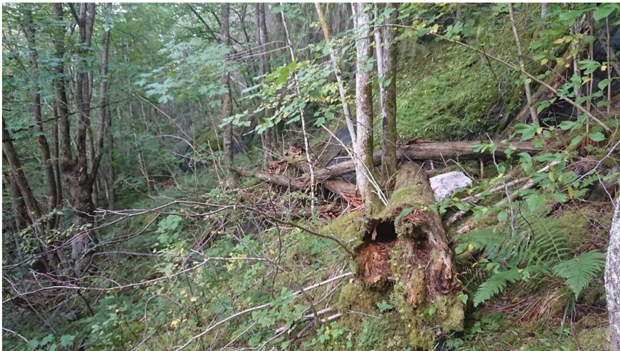
Dødvedrikt parti nær Skafsåvegen i undersøkingsområdet.

Områda dekkjer manglar i høve til mangelanalysen for skogvernarbeidet i Norge (Framstad m.f. 2017). Områdene dekker manglar i høg grad både for mangelnaturtypar, generelle manglar (særleg låglandsskog og skog med høg bonitet) og storområder. Total mangeloppfylling vert vurdert som høg. Det er avgrensa fleire lokalitetar med raudlista naturtypar. Det er typane frisk, rik edellauvskog og høgstaudegranskog som er representert.