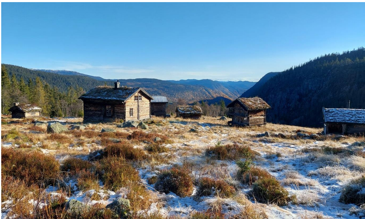
Gården Ripilen med lisidene til verneområdet Modalen på høgre side i biletet.

Etter høyring vil Statsforvaltaren oppsummera høyringa, kommentera eventuelle utsegner og utarbeida ei tilråding om vern til Miljødirektoratet. Miljødirektoratet vil deretter skrive innstilling til Klima- og miljødepartementet (KLD) og vedtak om freding blir gjort ved kgl. Res. av Kongen i statsråd.