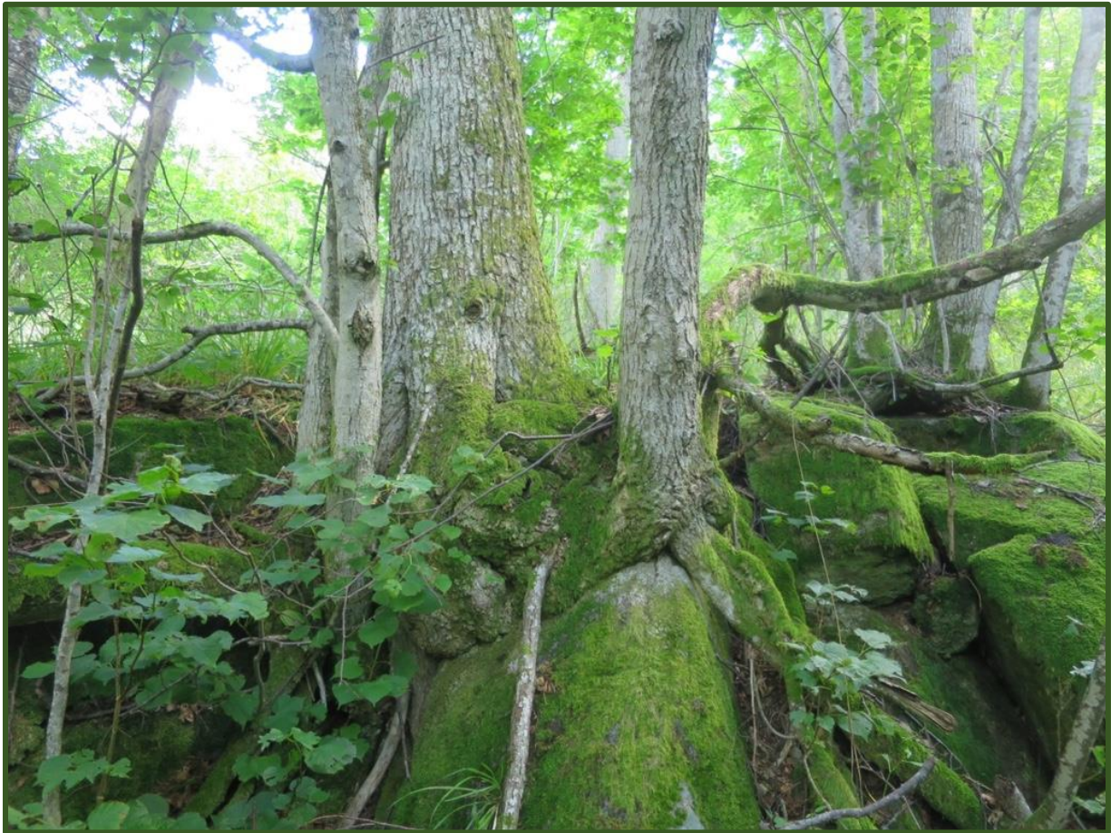
Gammel lindeskog med innslag av noe gammel eik på blokkmark