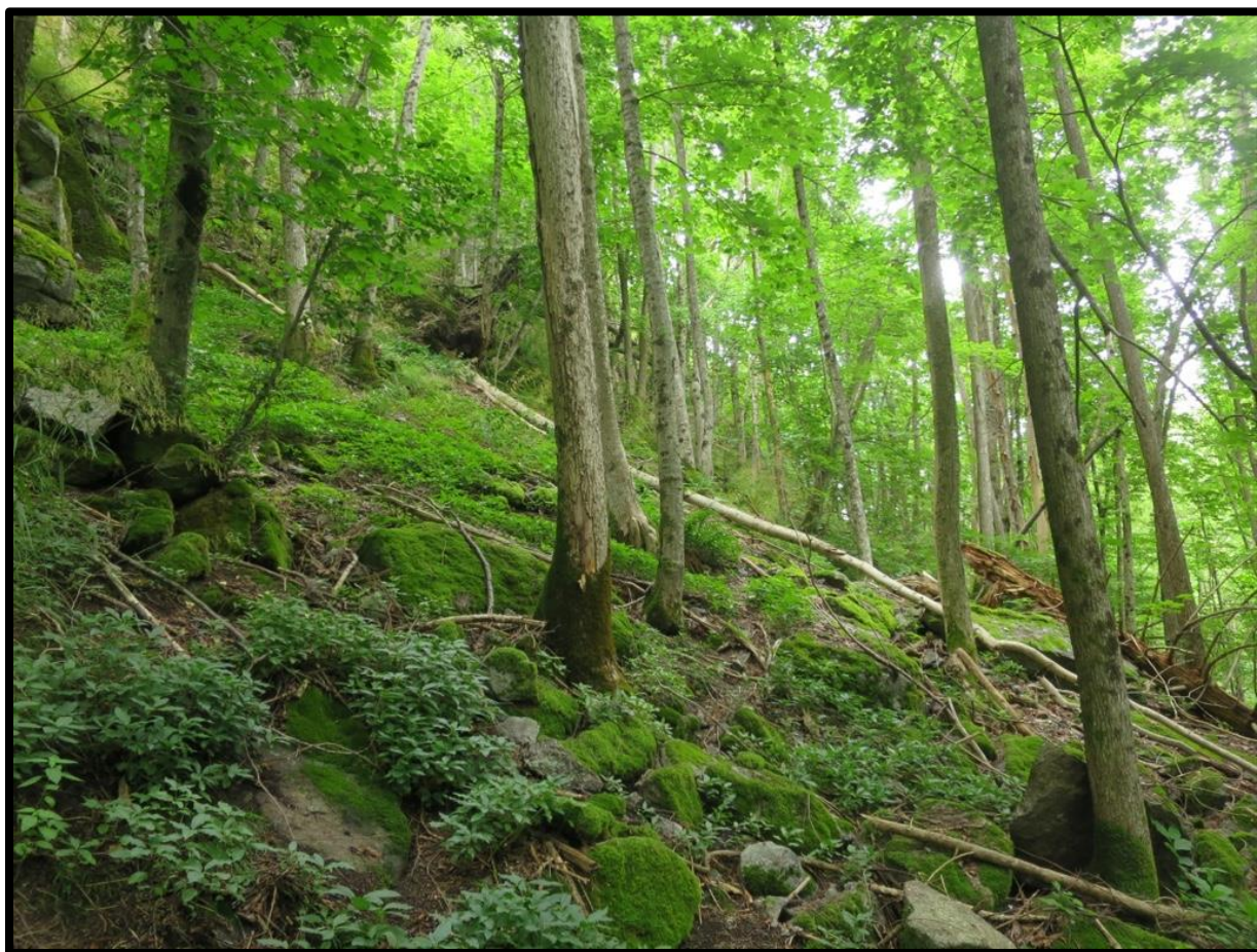
Rik og frodig edellauvskog i Hanakne