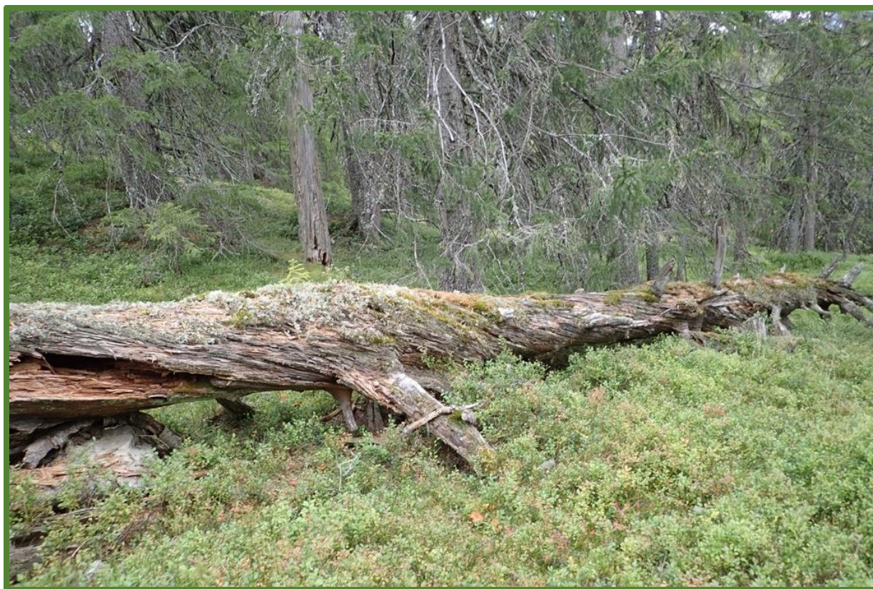
Gamal grandominert skog i kjerneområde 10.

Statsforvaltaren i Vestfold og Telemark Februar 2024