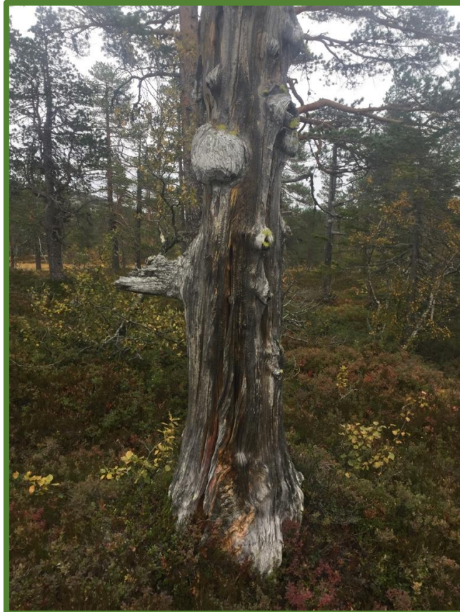
Furugadd med ulvelav.

Reiso, S. 2020. Naturverdier for lokalitet Kleppefjell NR (utv.) 2, registrert i forbindelse med prosjekt Frivilligvern 2019. NaRIN faktaark. BioFokus.