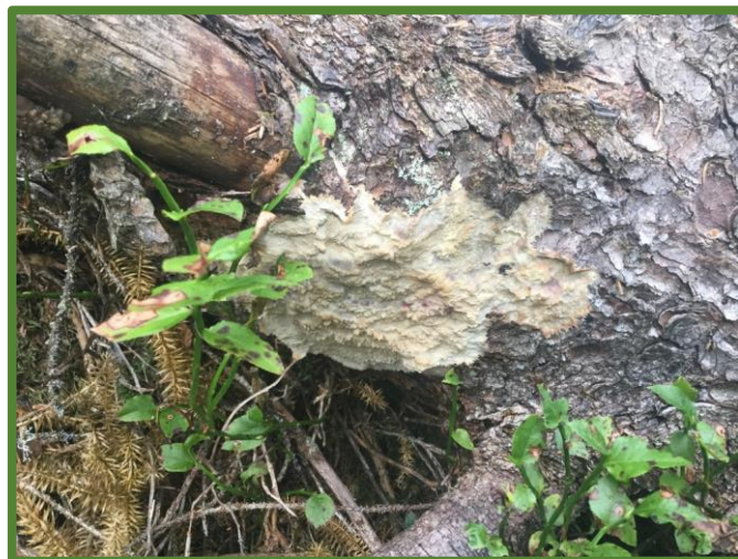
Rynkeskinn på lite nedbrutt granlåg langs Vesleåa.

Det er vanleg at det er opna for brenning av bål i store reservat (grense på om lag 700-1000 daa). Ein må då nytte tørrkvist eller ved ein har med seg, ein kan ikkje felle eller hogge opp daude tre.