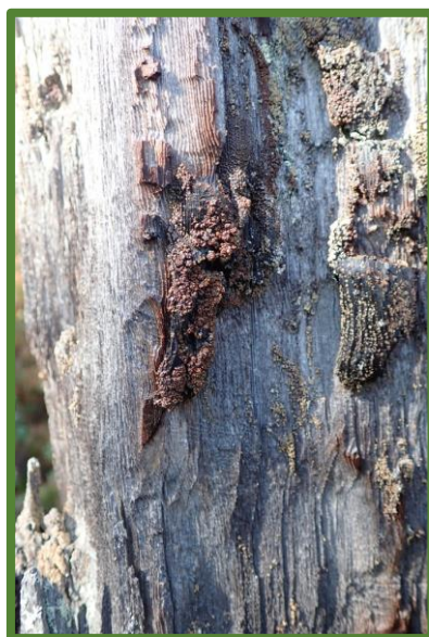
Mørk brannstubbelaav i kjerneområde 7.

*) Eigedomar med tilbodsareal: 65/7, 65/9, 61/6, 65/8, 69/2, 65/3, 61/5 og 61/11, 71/2, 72/2, 71/1, 69/1, 64/1, 72/1 og 68/1. Sjå og kap. 6, faktaarket.