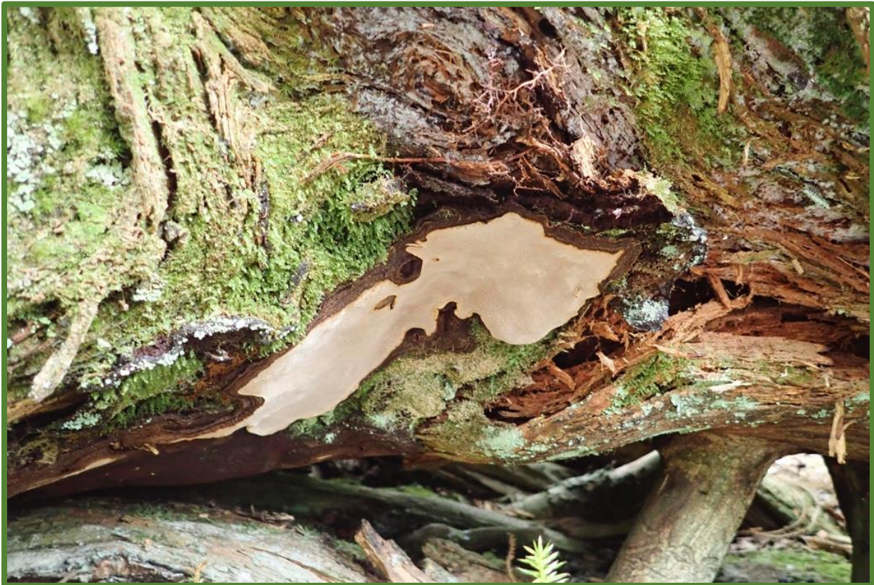
Svartsonekjuke i kjerneområde 9.