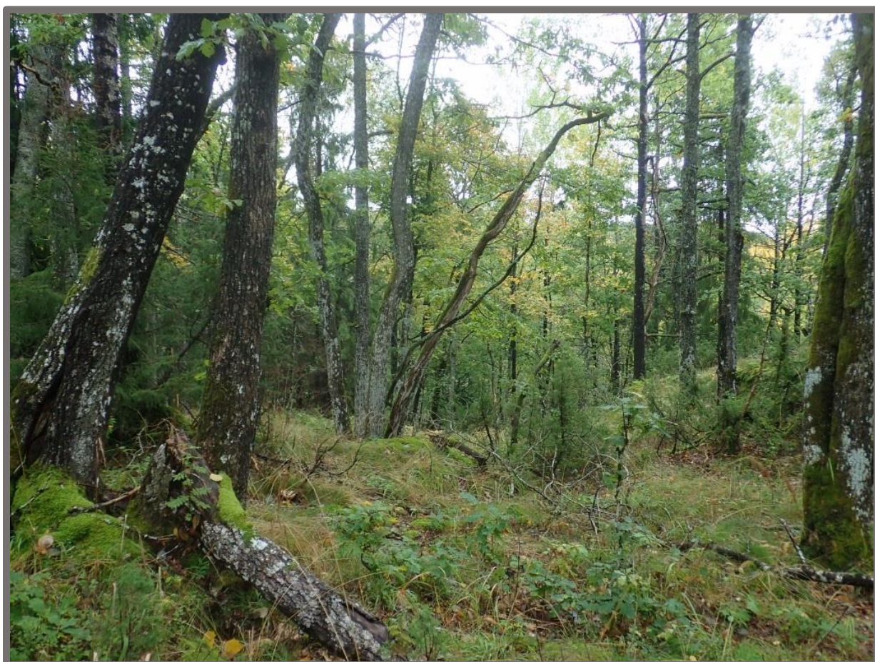
Eikedominert edellauvskog nedenfor Mellomknuten.

Statsforvalteren i Vestfold og Telemark fylke Mars 2022