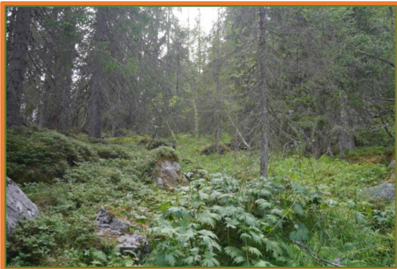
Høgstaudevegetasjon innenfor verneforslaget.

Statsforvaltaren i Vestfold og Telemark fylke Januar 2021