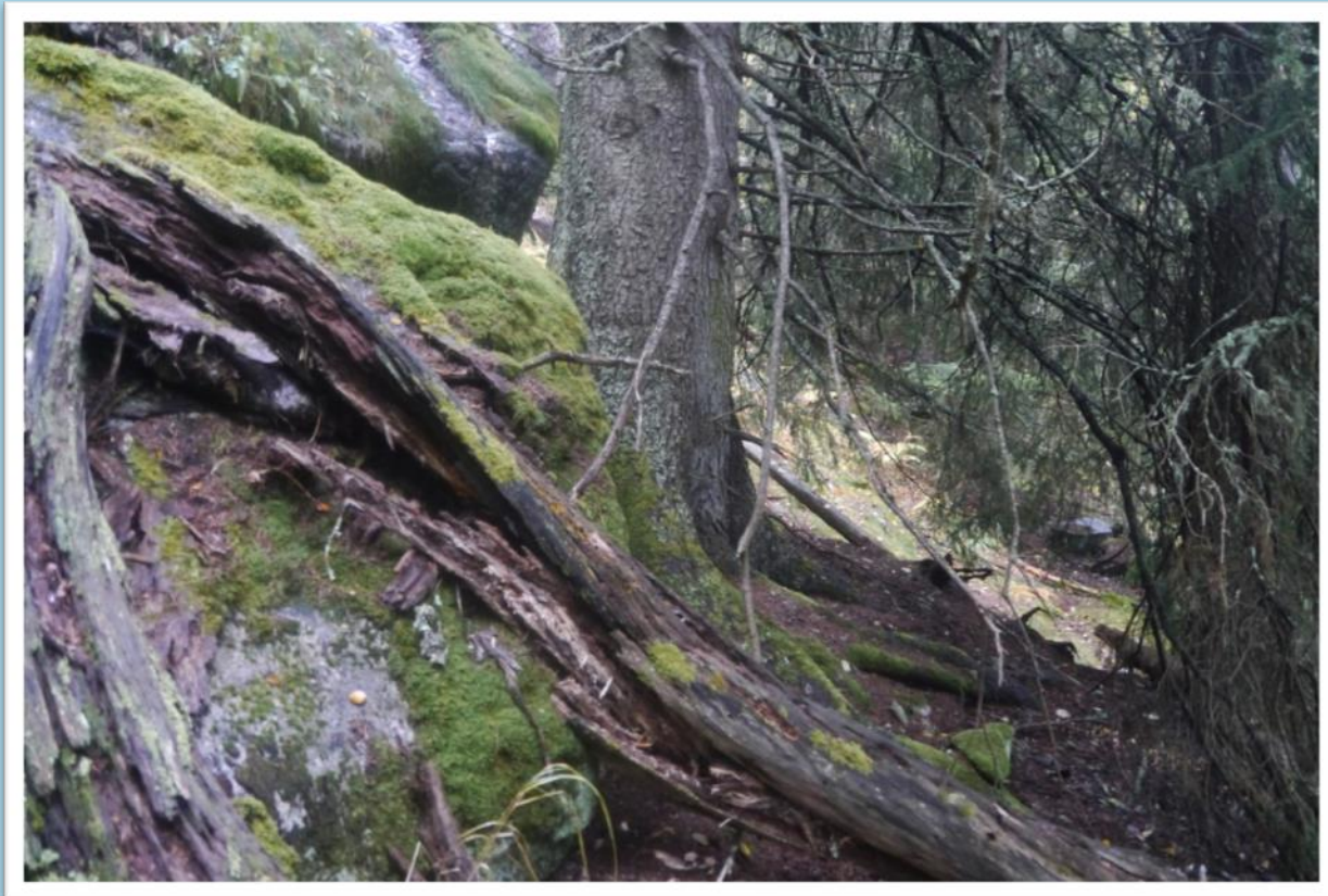
Grov gran i eldre granskog