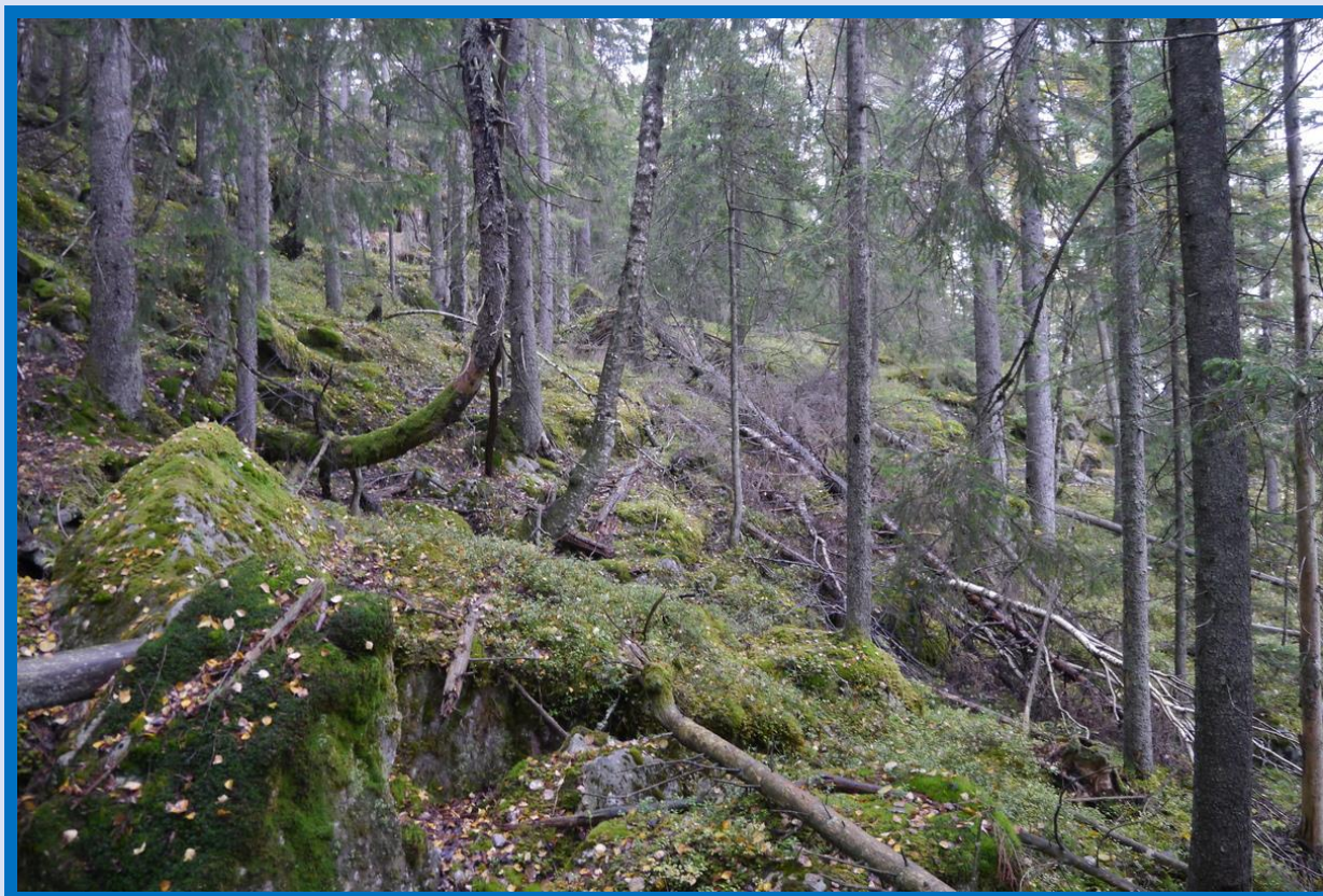
Eldre granskog i sammenbruddsfase sentralt vest i verneforslaget.

Brynjulvsrud J. G. 2018. Naturverdier for lokalitet Bjørndalsfjell, registrert i forbindelse med prosjekt Frivilligvern 2017. NaRIN faktaark. BioFokus. ( http://borchbio.no/narin/?nid=6121 )