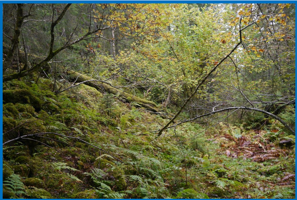
Utkant av høgstaudekog.