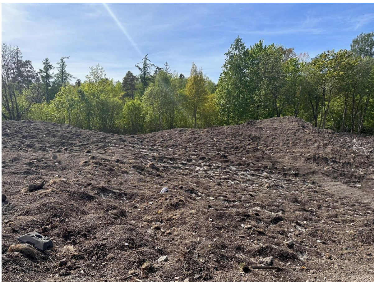
Oversikt (retning sør → nord)