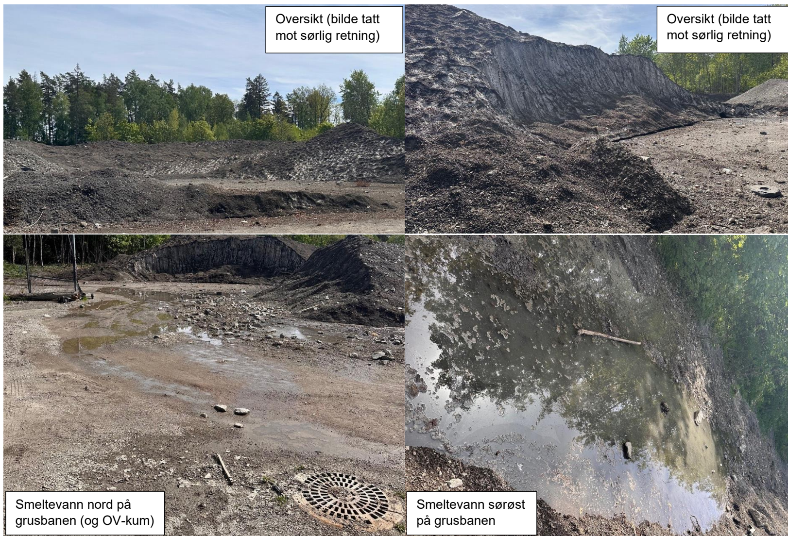
Figur 2: Bilder fra snødeponi tatt under befarings 15.05.24. Øverst: oversikt over snødeponi. Nederst: akkumulering av smeltevann i nord (t.v.) og sør (t.h.)