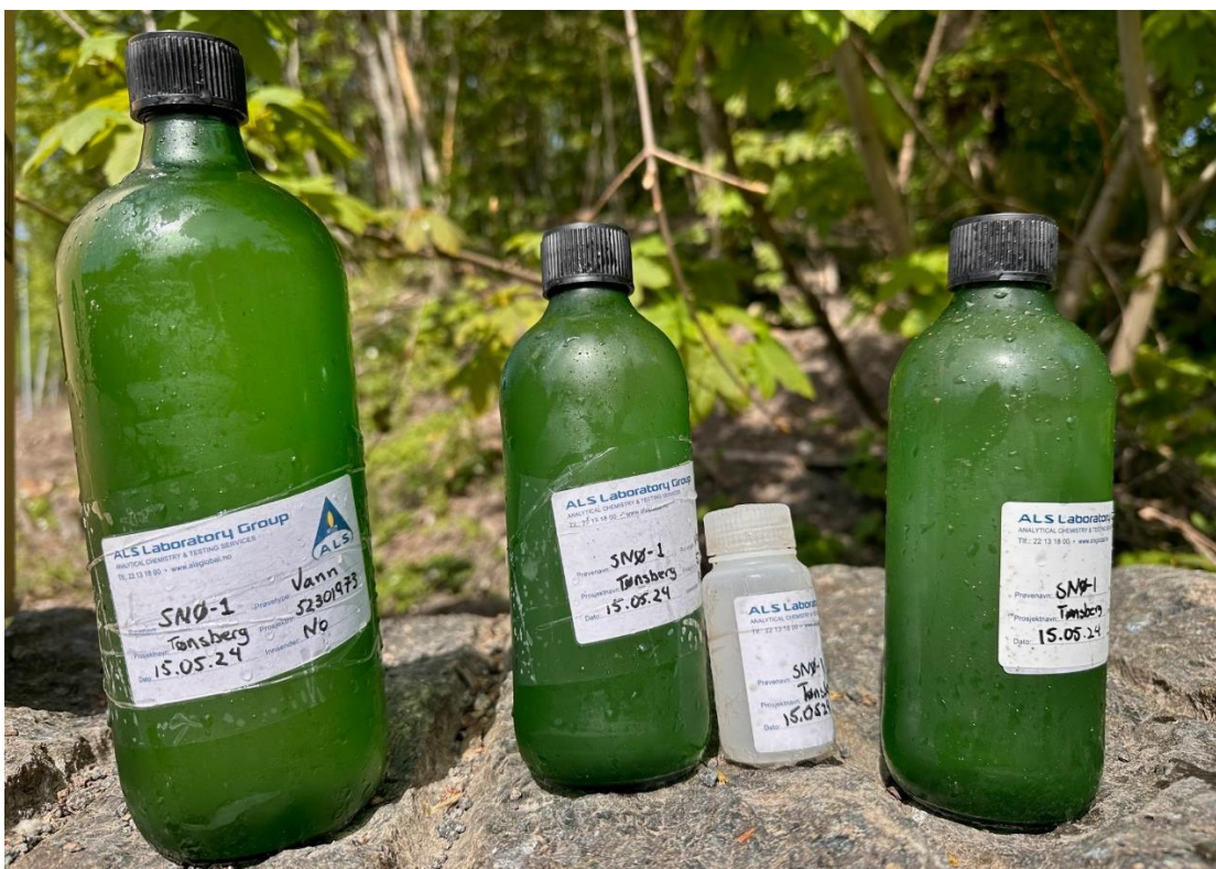
Figur 5: Oppfylte flasker fra prøvetakning av smeltevann 15.05.24.

Prøvene ble analysert ufiltrert for metaller, PCB, PAH, BTEC og olje (THC). Ufiltrert prøve gjør at både løst og partikkelbunden forurensning fremkommer i resultatene.