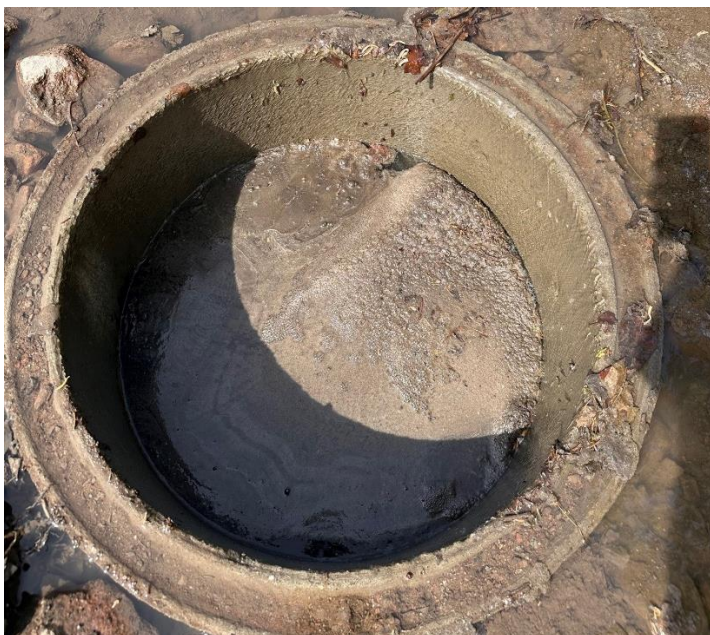
Figur 4: Kum for prøvetakning av smeltevann.