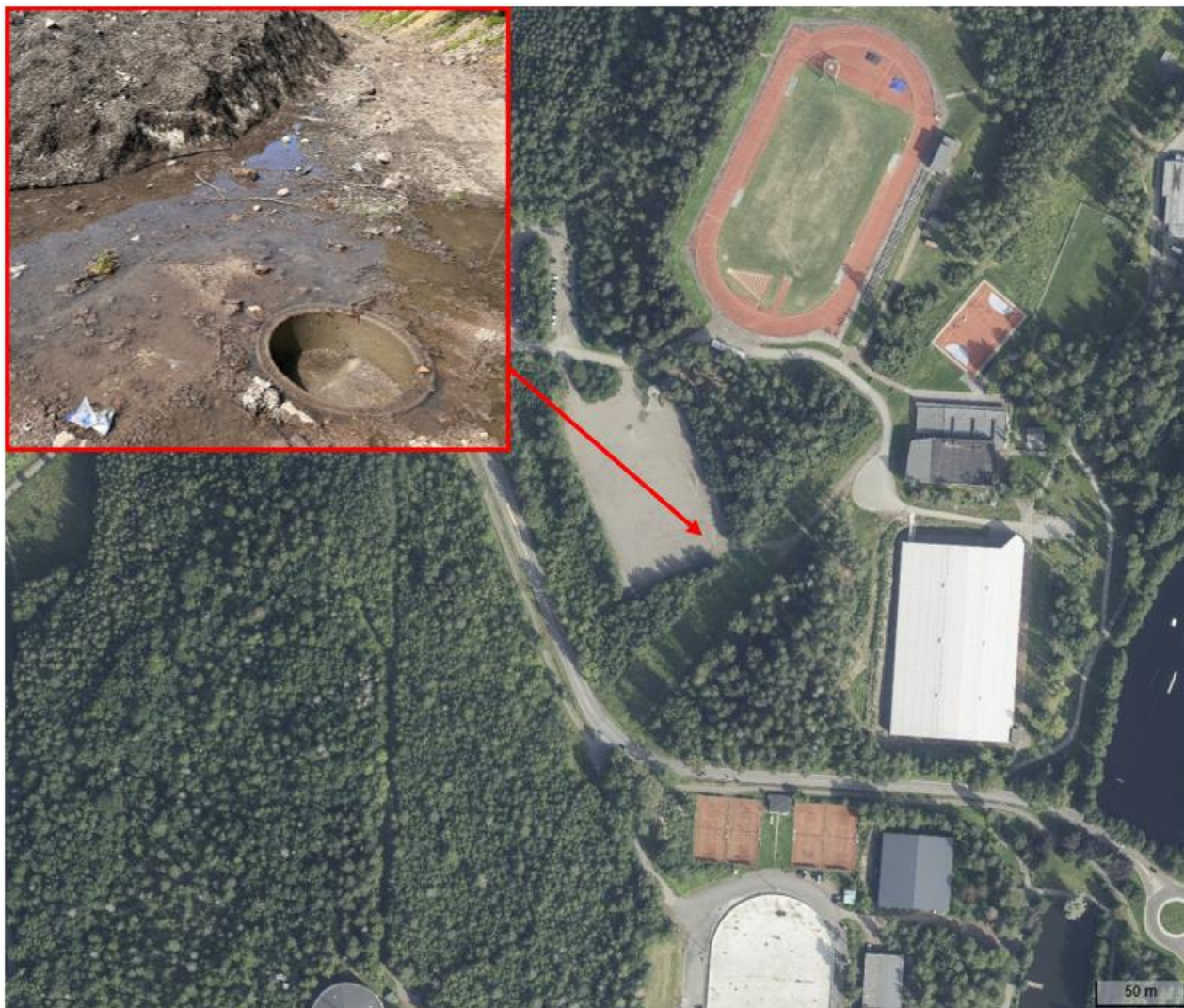
Figur 3: Plassering av kum for oppsamling og prøvetakning av smeltevann. (Bilde av kum ble tatt under prøvetakning 15.05.24)

Prøvetakning ble utført ved å senke flasker ned i kummen og fylle de helt opp (Figur 4 og Figur 5). Blader og rusk ble fjernet.