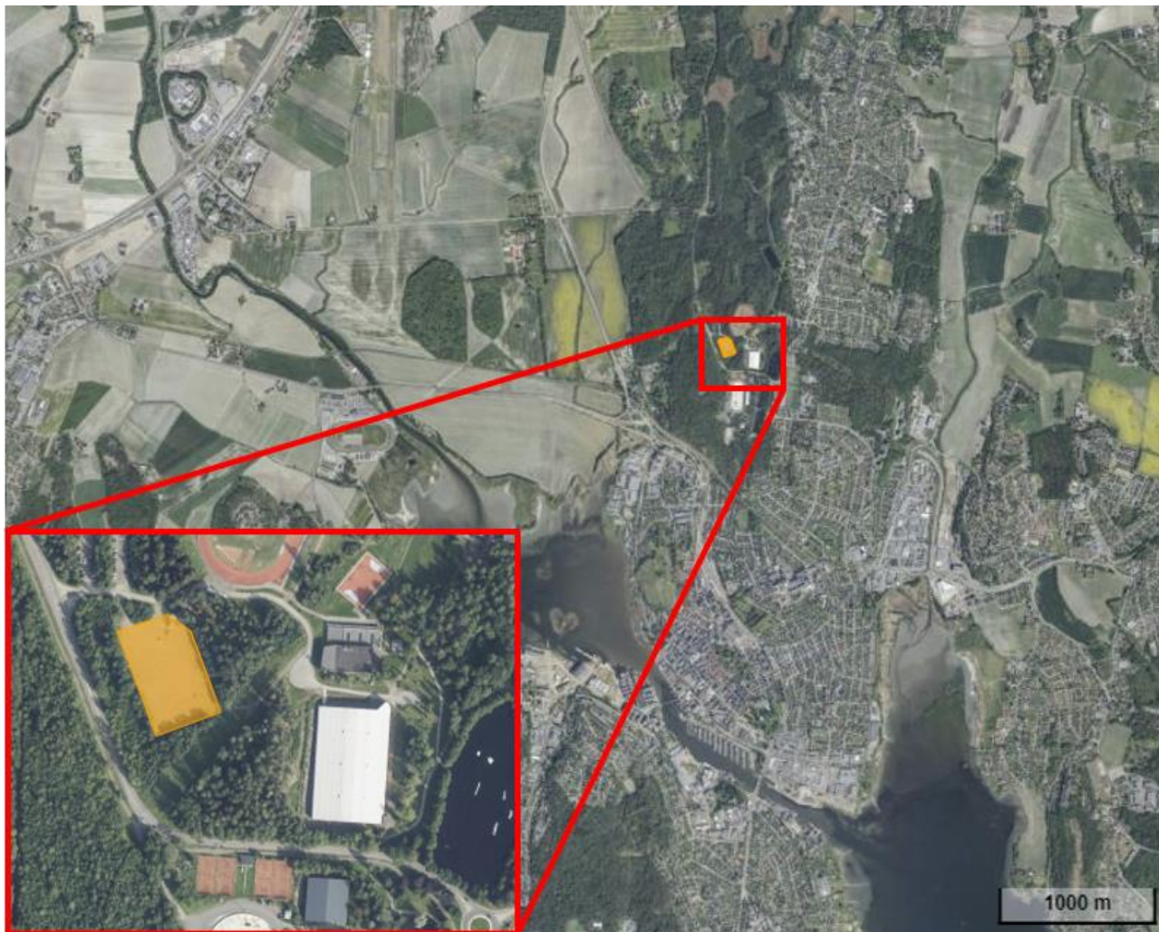
Figur 1: Oversikt over Grevskogen i Tønsberg kommune. Grusbanen som ønskes brukt til snødeponi (på eiendom gnr./bnr. 51/376) er markert med oransje.

Tønsberg kommune har de siste to vintersesongene (H22/V23 og H23/V24) midlertidig deponert snø fra sentrumsområder på en grusbane på Grevskogen (gnr./bnr. 51/376, Figur 1). Kommunen ønsker å benytte området til permanent snødeponi.