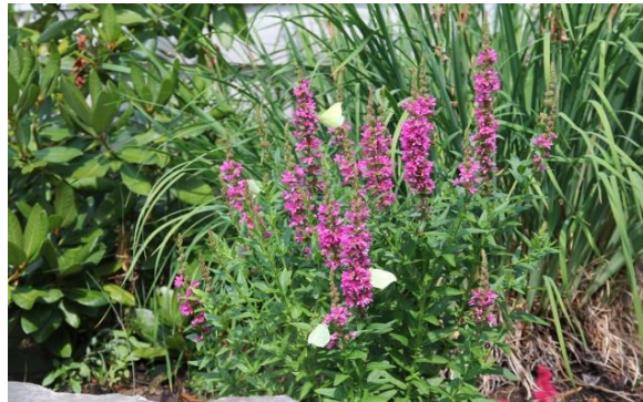
Sommerfugler tiltrekkes av dekorative planter. Det skaper liv i hagen. I Nissedal.