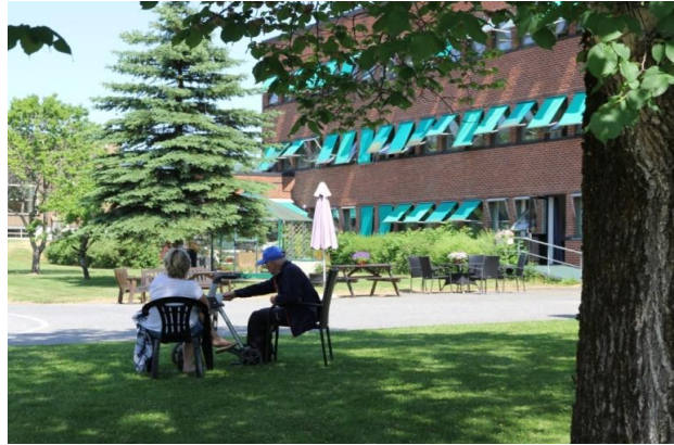
Det store treet gir beskyttelse mot solsteken. Naturen kan gjerne være nær husene. Beboere og besøkende i samtale under naturens tak ved Gjerpen sykehjem.

Naturkontakt er grunnleggende viktig og gir: