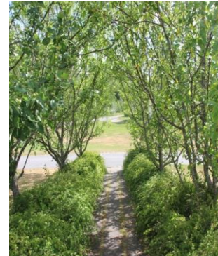
Tett på greiner, blader og busker gir berøring, nærhet og romfølelse i alléen (Fyresdal)