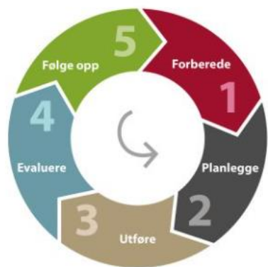
Figuren viser Modell for kvalitetsforbedring

Støtte sykehjemmets ledelse (og de ansatte) i å implementere og bruke Trygghetsstandarden gjennom å