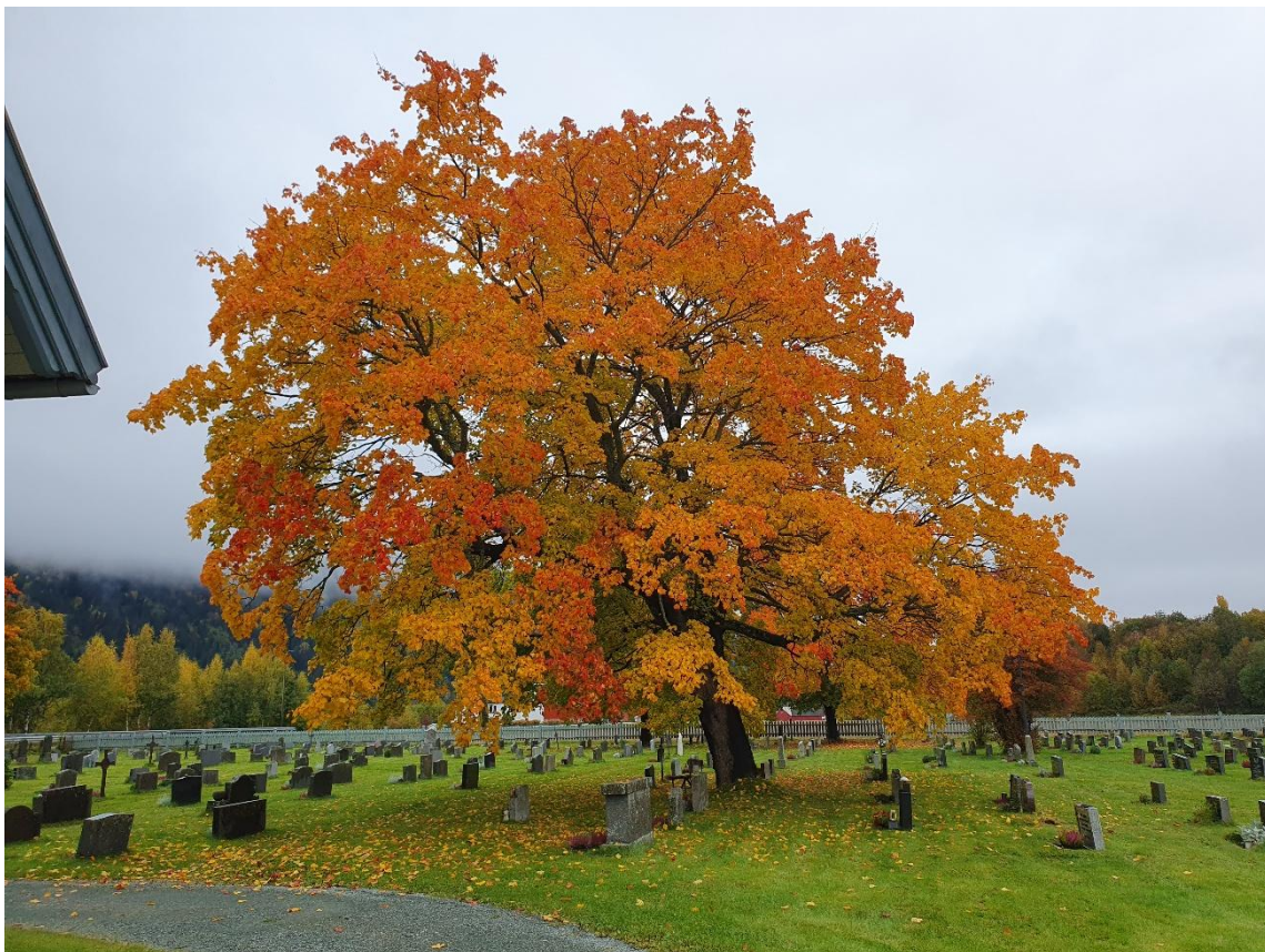
Karakteristisk og storslagent tre på Horg kyrkjegard, Trøndelag.

I samband med utøving av offentleg styresmakt, har ein plikt etter naturmangfoldsloven til å vurdere tiltakets konsekvensar opp mot naturmangfaldet, sjå naturmangfoldloven § 7.