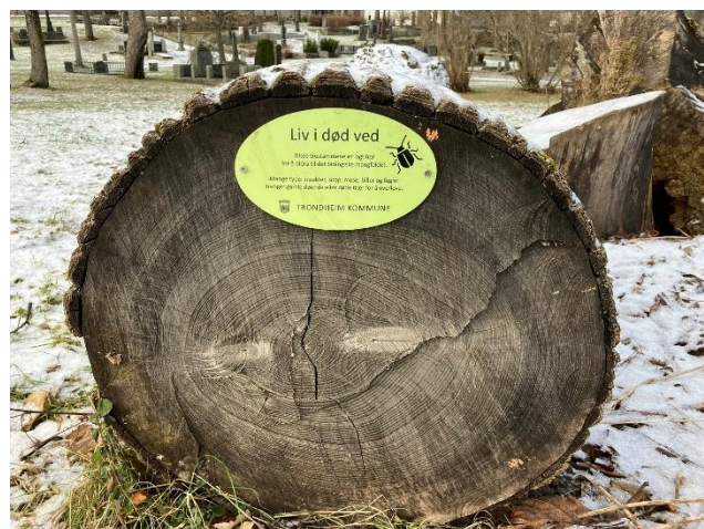
Infoskilt ved trestamme på Niddarosdommen.