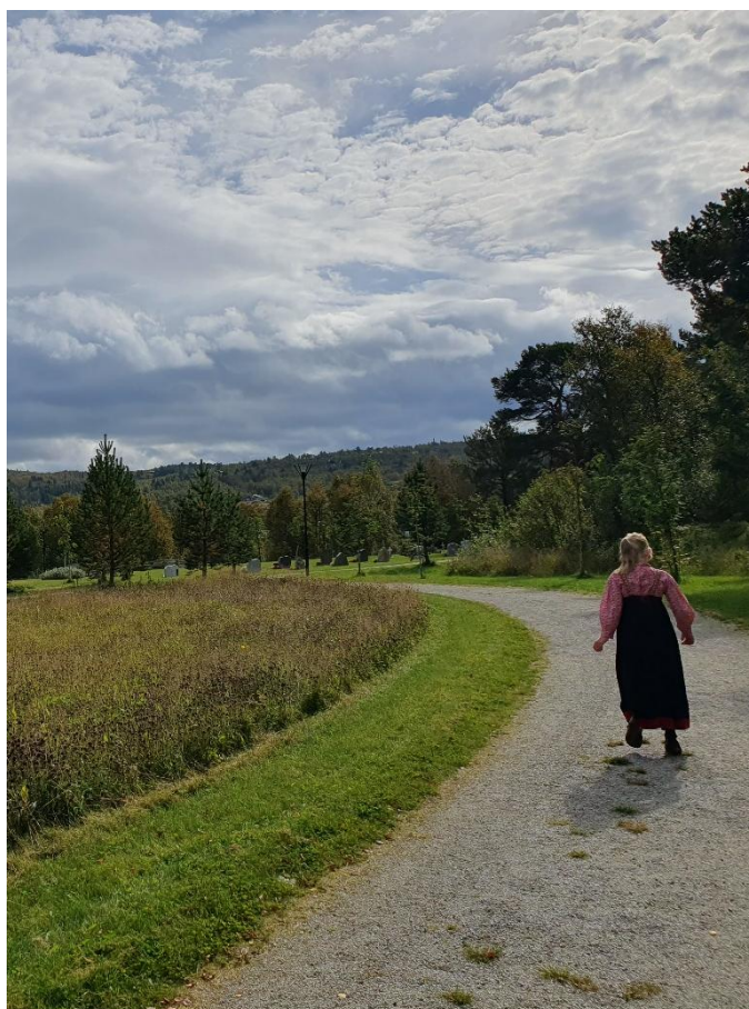
Til venstre: Insektsliv på Lørenskog kirkegård. Til høyre: Geilo gravlund, Geilo.