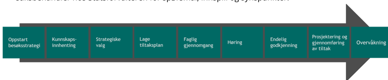
Figur 2. Flyttdiagram som viser viktige deler av arbeidet med besøksforvaltning. Kilde: Miljødirektoratet. Veileder for besøksforvaltning i norske verneområder 6 .

For å sikre lokal medvirkning vil det bli arrangert ulike former for medvirkningsmøter 5 og åpne arbeids- og informasjonsmøter for å få inn ytterligere kunnskap og innspill. Det kan også opprettes arbeidsgruppe(r) for arbeidet hvis behov. Statsforvalteren ønsker innspill på hvordan vi i denne prosessen på best mulig måte ivaretar lokal medvirkning, og sikrer at besøksstrategien får god lokal forankring og relevans. Statsforvalteren i Troms og Finnmark har som et overordnet mål å arbeide for gode oppvekst-vilkår og gode framtidsutsikter for barn og unge. I vårt arbeid skal vi lytte til og involvere barn og unge i vår oppgaveløsning. Vi vil gjerne ha forslag på hvordan vi kan involvere barn og unge både i arbeidet med besøksstrategien, og i framtidig forvaltning av naturreservatet. Underveis i arbeidet kan de som ønsker det, ta direkte kontakt med saksbehandler hos Statsforvalteren for spørsmål, innspill og synspunkter.