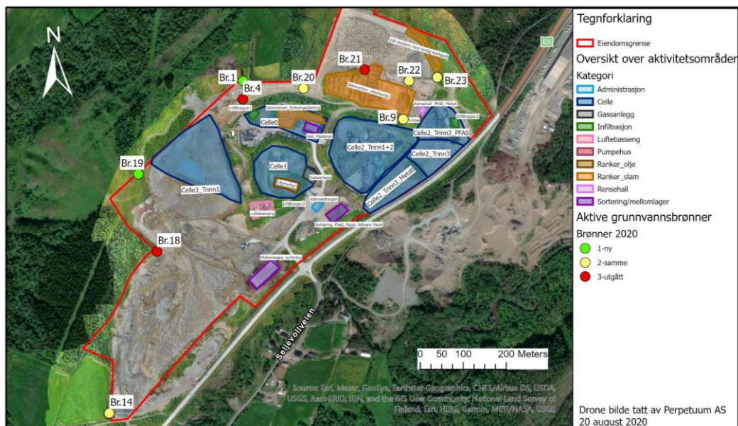
Figur 1: Kart over Stormoen som viser aktivitetsområder og aktive grunnvannsbrønner. Værstasjon bli flyttet i uke 36, 2020 fra brønn18 til ved siden av gassanlegget.

I 2020 (uke 36) ble værstasjon flyttet fra en vind utsatt område på deponiet som var ved siden av referanse brønn 18, til en mer representativ lokasjon nærmere til de deponicellene og rett ved deponigass anlegg.