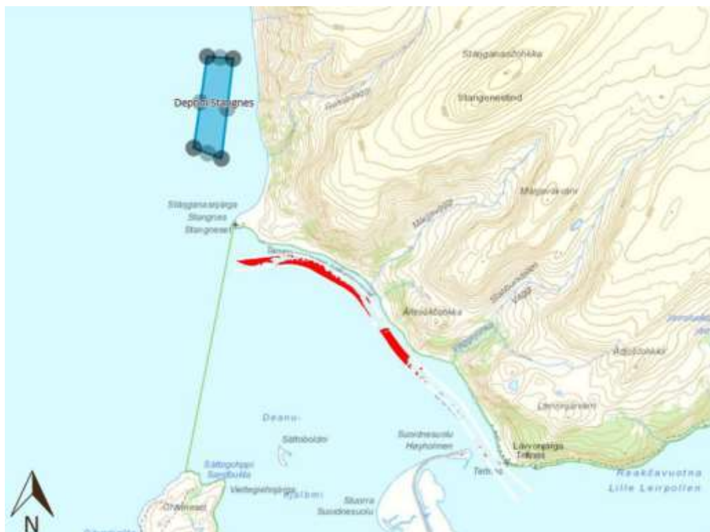
Figur 1-1: Oversiktskart utdypingsområdet og deponi.

Foreliggende rapport omhandler miljøgeologiske og biologiske undersøkelser utført i 2016 ved det aktuelle deponiet ved Stangnes i Tanafjorden.