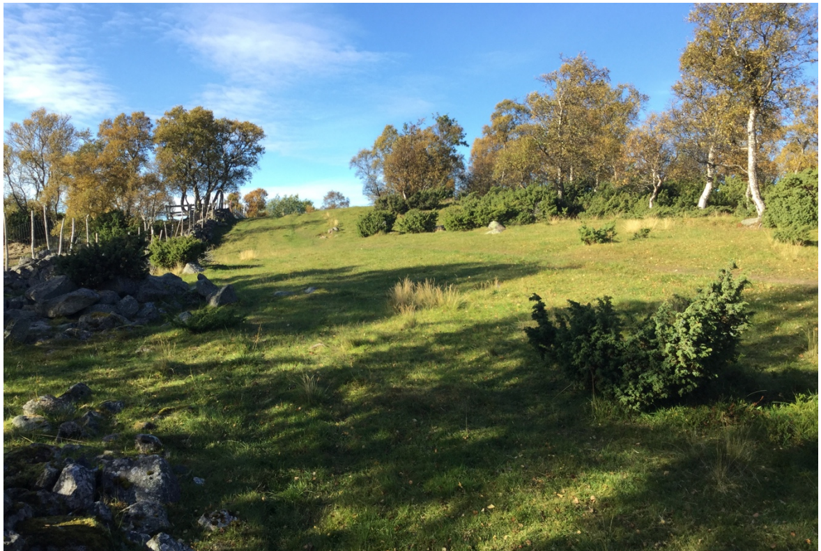
Den østlige delen av lokaliteten, sett mot vest. Eineren står tett inntil lokaliteten i øvre kant (nord), og sammen med bjørka bør den fjernes for å åpne opp for mer beiteareal og bedre betingelser for naturbeitemarksarter. Foto: Pål Alvereng (2017)