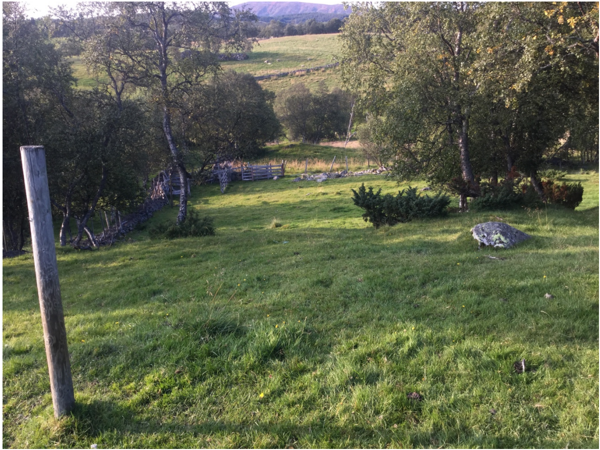
Vestlig del av lokaliteten sett mot vest. Her er det litt einer som med fordel kan fjernes. Det vil dessuten være en fordel for naturmangfoldet om det felles en del bjørk og dermed «presser» skogen tilbake noe mot nord og åpner opp for mer beite.