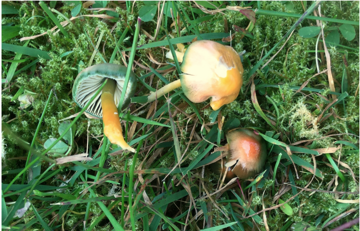
Papegøyevokssopp funnet på lokaliteten i 2017.