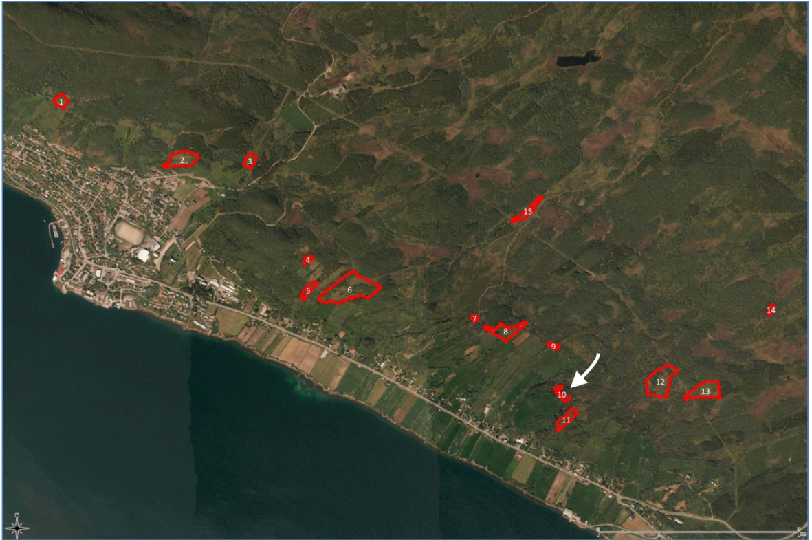
Flyfoto som viser hvor plasseringen av lokaliteten i UKL Skallan-Rå. Borkenes sentrum til venstre i utsnittet.