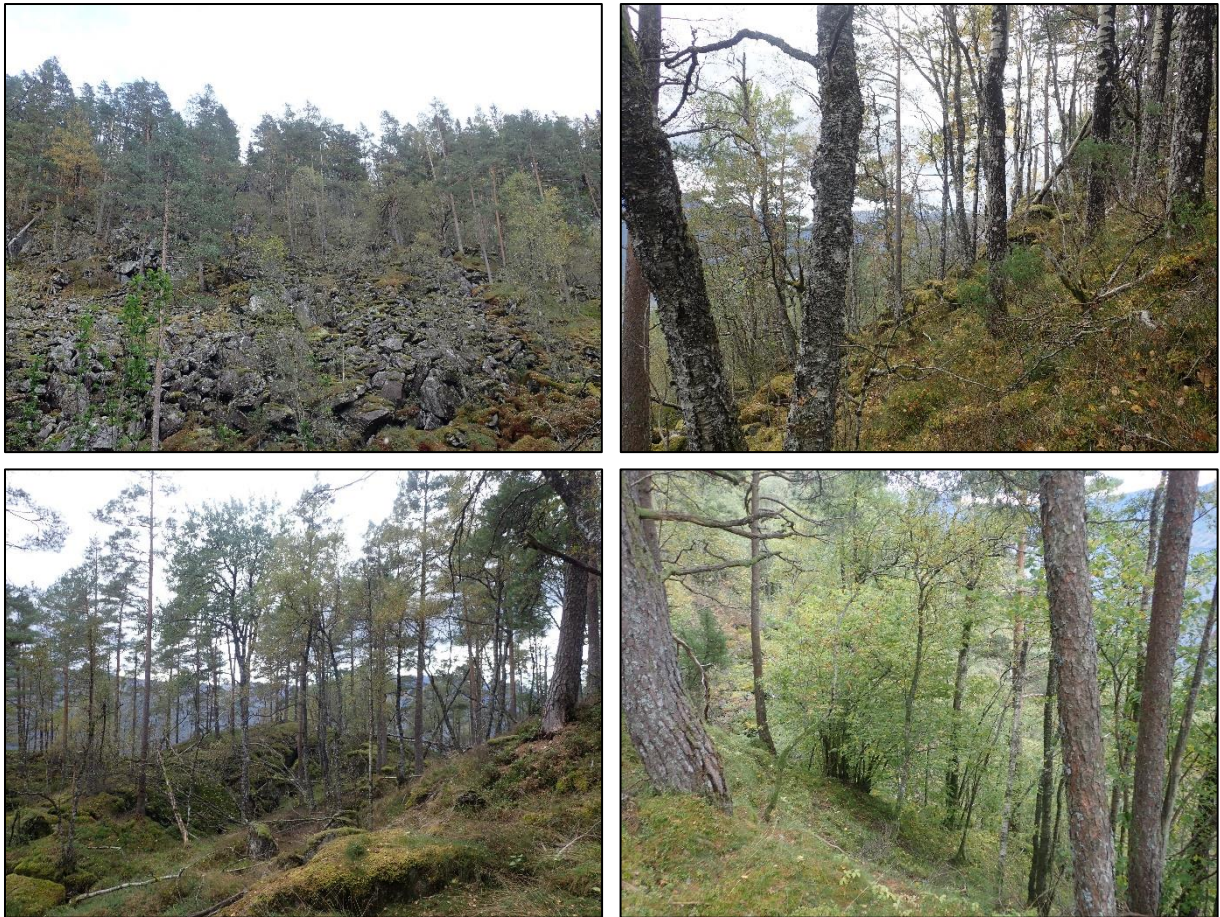
Figur 74. Øverst: Hele undersøkelsesområdet er svært bratt steinur (t.v.). Alderen på skogen varierer noe med innslag av eldre og grove trær (t.h.). Nederst: Kjerneområde 1 er registrert som gammel barskog, med ganske mye død ved og i hvert fall noen gamle trær (t.v.). Kjerneområde 2 er rik edelløvskog, men i de høyestliggende delene er det kun noe innslag av hassel og eik i furuskog (t.h.).