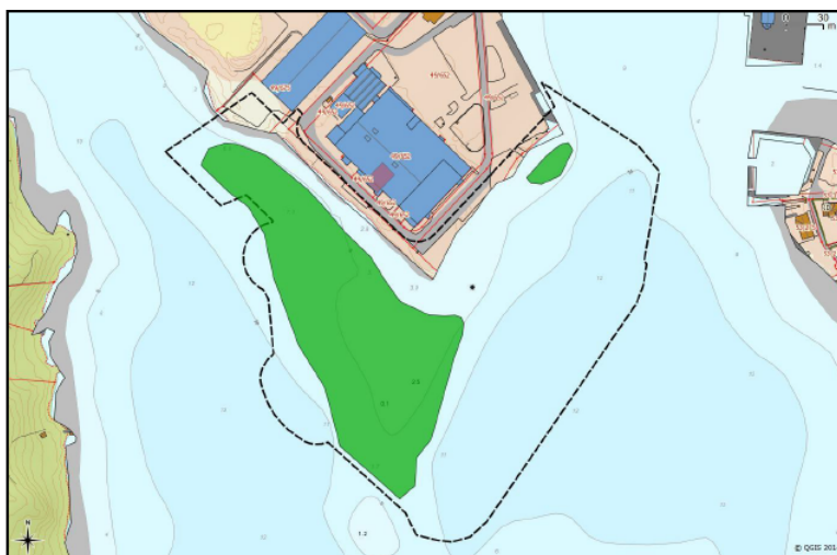
Fig 2: Ålegraseng i umiddelbar nærhet til tiltaket ved Strand Båtsenter AS. Ecofact rapport 383.

I følge temakart-Rogaland 1 er det modellert ålegras i tiltaksområdet, og det er registrert ålegras av svært viktig verdi (verdi A) i nærhet av det omsøkte tiltaksområdet, i Jørpelandsvågen. I en rapport fra Ecofact 2 er det registrert en stor ålegraseng i umiddelbar nærhet av tiltaksområdet (Fig 2). Denne ålegraseng har fått verdi B i rapporten fra Ecofact, men er seinere oppgradert til verdi A 3 på bakgrunn av overlapp med gytefelt. Ålegrasenger er av stor betydning for biologisk mangfold generelt, inkludert som oppvekstområde for kysttorsk.