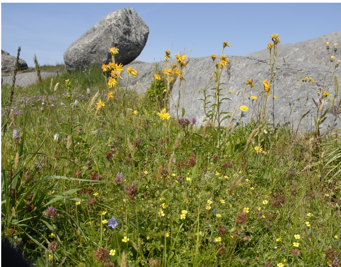
Haver – Hå kommune