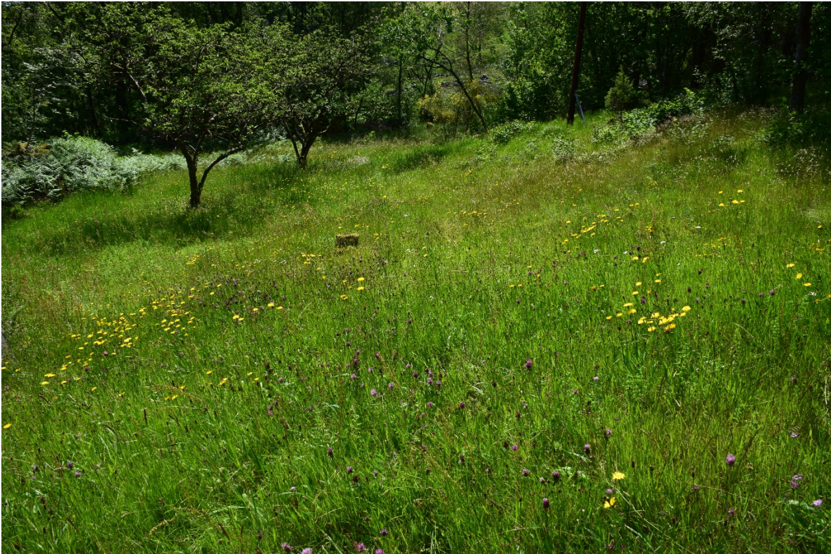
Kattura – Sandnes kommune