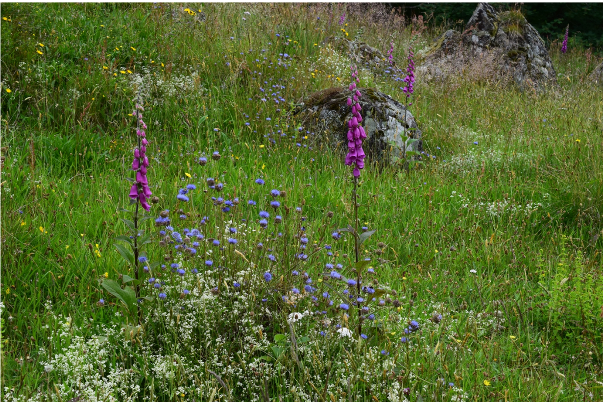
Steine – Eigersund kommune