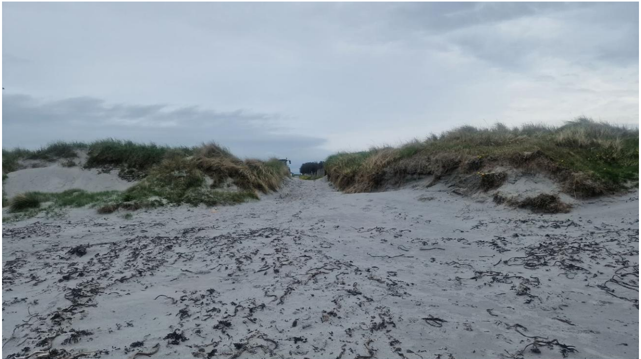
Figur 2: Innkjøring til strandflate via godkjent transporttrasé.