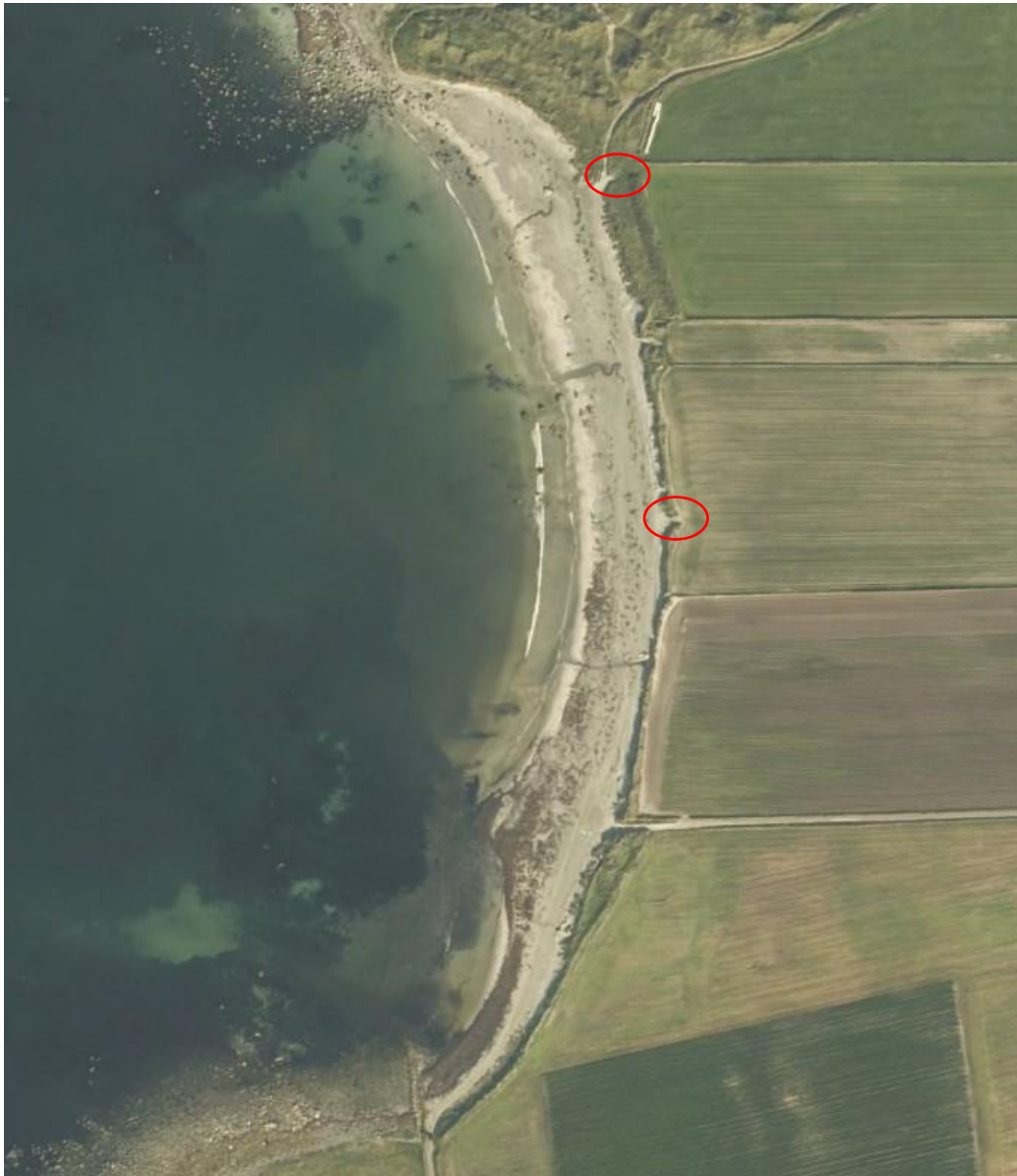
Figur 3: Ønskede traséer gjennom sanddynene for tilkomst til jordbruksarealene for vanning markert med røde sirkler.