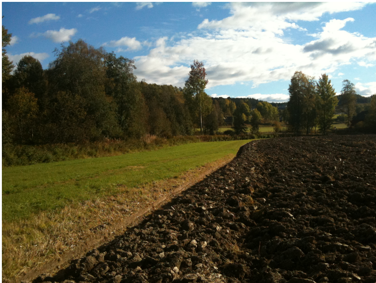
Figur 5. Grasdekte kantsoner langs vassdrag.

samt å øke avstanden fra jordet til vannforekomsten for å redusere påvirkning av gjødselspredning og sprøyting (Blankenberg m.fl. 2019). Det kan forventes god effekt av grasdekte kantsoner på arealer med fare for overflateavrenning, og på flomutsatte arealer. På generelt grunnlag kan derfor tiltaket forventes å ha god effekt på områder med potet- og grønnsaksproduksjon ettersom disse jordarbeides og mangler vegetasjonsdekke store deler av året, som fører til at jorda er mer utsatt for overflateavrenning og erosjon. Lokale forhold som topografi, jordtype, driftsform og utforming av kantsonene påvirker effekten av kantsonene (Blankenberg m.fl. 2017).