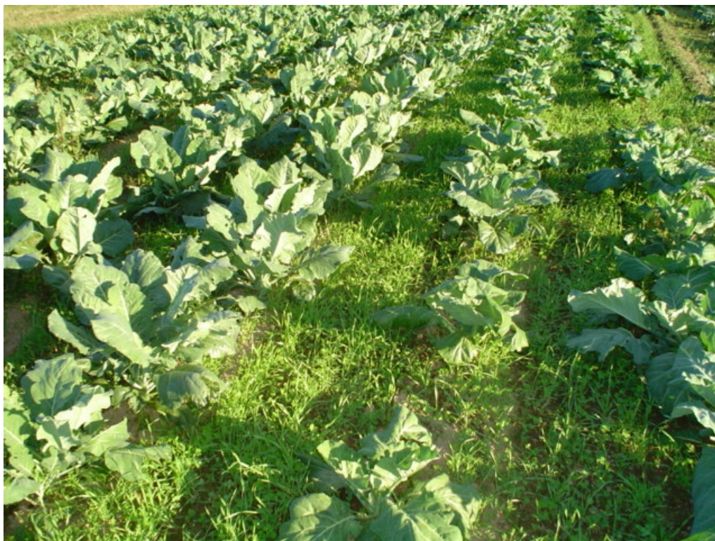
Figur 2. Fangvekster undersådd i kål.