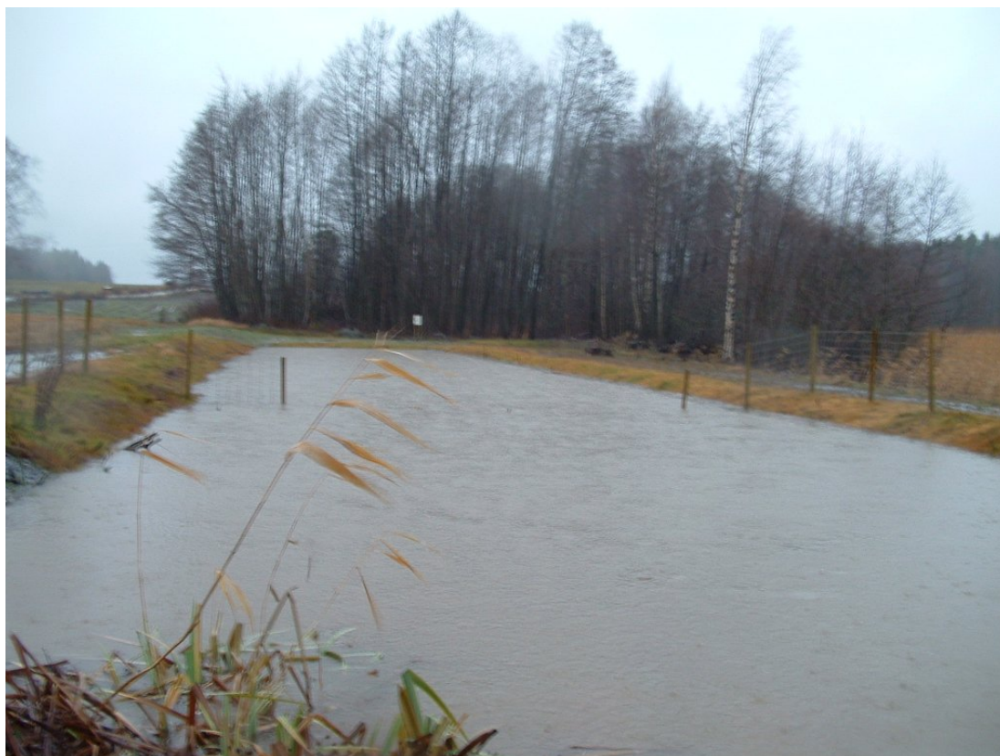
Figur 6. Fangdam for tilbakeholdelse av jord og næringsstoffer.

Høy oppholdstid i fangdammen er en fordel når det kommer til renseeffekten på næringsstoffer. Både renseeffekten av nitrat og løst fosfat er relativt liten i fangdammer. Høye P-AL verdier i jorda, som gjerne er tilfelle i områder med potet- og grønnsaksproduksjon, kan medføre høyere konsentrasjoner av løst fosfat, og dårlig renseeffekt for den fraksjonen. De høye P-AL-verdiene betyr også at det er høyt innhold av fosfor i partiklene som sedimenterer, noe som kan bidra til god renseeffekt av fangdammen for den delen av avrenningen fra arealer med grøntproduksjon. Renseeffekten reduseres ved høy avrenning og kort retensjon i fangdammen. Fangdammer er mest effektive i områder med mye erosjon, med store partikler og aggregater som raskt sedimenterer, og er spesielt effektivt ved store jordtap. Fra en del potet- og grønnsaksarealer er det store tap av partikler og partikkelbundet fosfor, og for slike områder vil en fangdam kunne ha stor effekt. Stor erosjon og stor tilbakeholdelse av partikler fører til at sedimentasjonskammeret fylles opp hurtig, noe som krever hyppig tømning, dersom renseeffekt ikke skal reduseres (Øygarden m. fl. 2019).