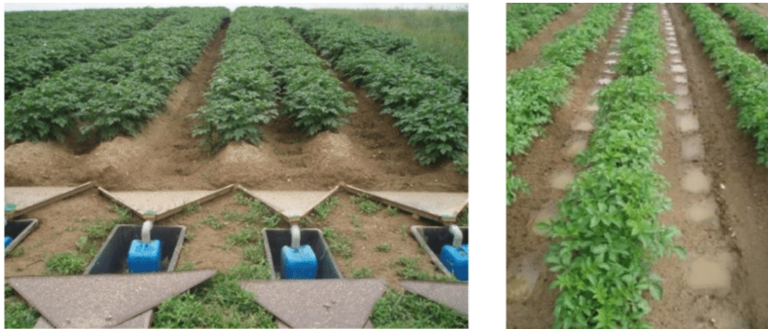
Figur 4. Furer mellom rader i grøntproduksjon som tiltak mot erosjon og avrenning (Vejchar m.fl. 2017).

kalt «tied ridging», «furrow diking» eller «dammer diking» være et lovende tiltak. De små rektangulære forsenkningene har som hensikt å fordrøye og infiltrere vannet, både som et tiltak som kan øke vanninnhold og tilgjengelighet i jorda og som et vannmiljøtiltak. Tiltaket har vist å ha god effekt på overflateavrenning (Vejchar m.fl. 2017).