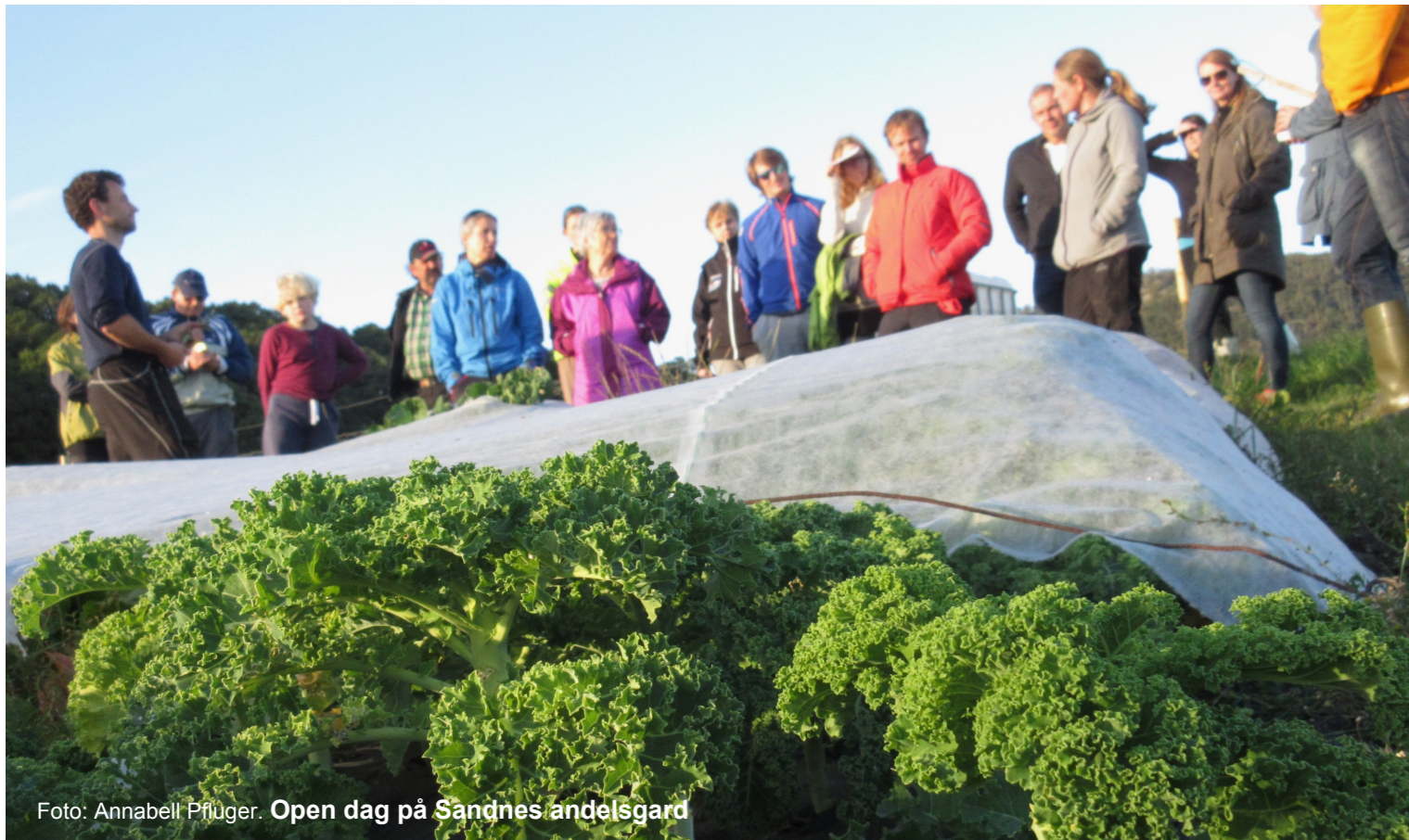
Open dag på Sandnes andelsgard