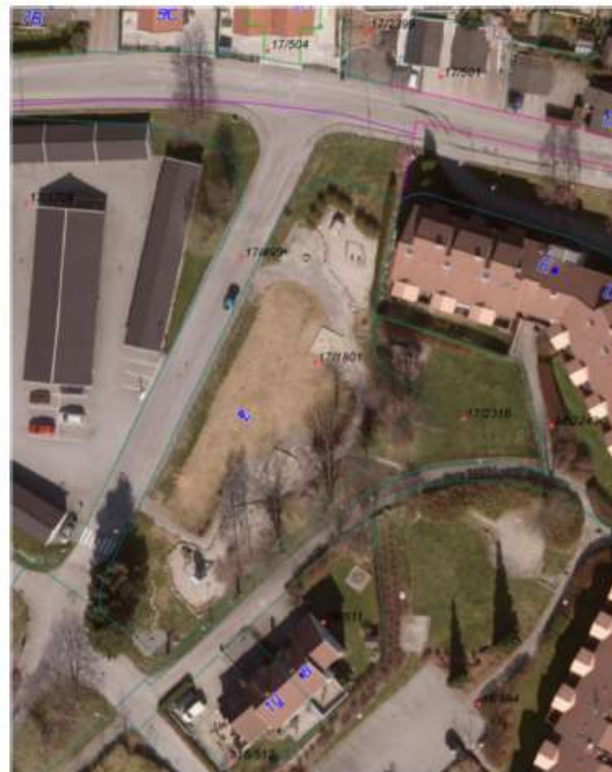
Kart og flyfoto av den gamle barnehagetomten.