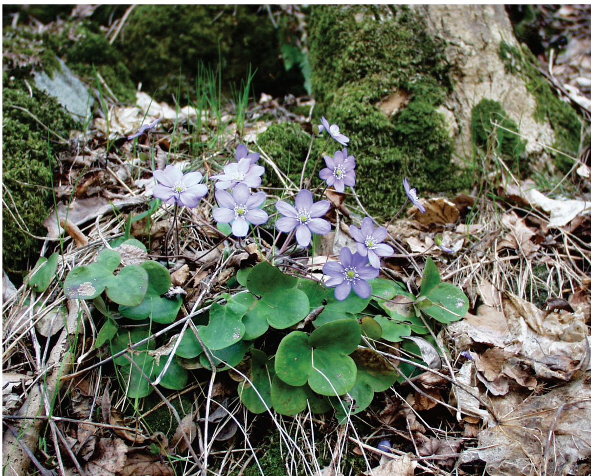
Figur 1 Blåveis er vanlig i løvkoglia.

Løvkoglia er bratt, sørvestvendt med ur/rasmark og iblandet finere materiale og skjellsand. Dette gir forutsetninger for varmekjære arter av løvtrær og andre organismer med spesielle krav til livsmiljø. Lia domineres av en alm-lindeskog med hassel og eik, alm og ask. Det er en del svært store løvtrær og enkelte er innhule ( alm, eik og ask ). Floraen har varmekjære og krevende arter som åkermåne, lakrismjelt, kantkonvall, marianøkleblom, skogsvinerot, moskusurt, nesleklokke og fingerlerkespore. Det er rikelig med blåveis i deler av området.