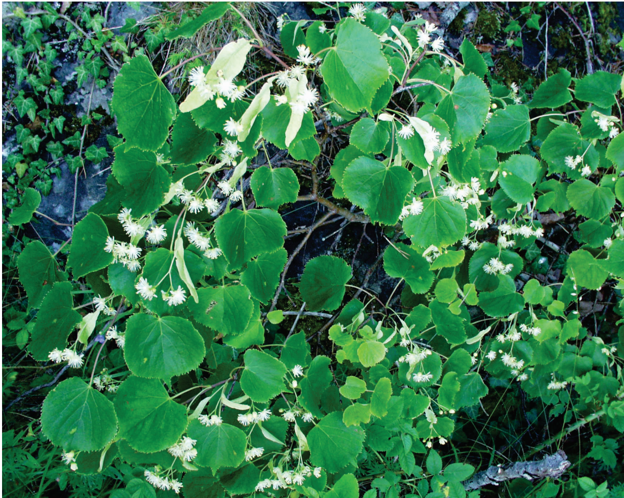
Figur 7 Lind er vanlig i reservatet, her i blomst.

SNO har oppsynsmyndighet med hjemmel i lov av 21. juni 1996 om statlig naturoppsyn, og har politimyndighet etter følgende lover: friluftsløven, naturmangfoldloven, motorferdselsloven, kulturminneloven, viltloven, lakse- og innlandsfiske-loven, samt deler av forurensningsloven. I tillegg til kontrolloppgavene etter disse lovene skal oppsynet drive veiledning og informasjonsarbeid, skjøtsel og tilrettelegging, registrering og dokumentasjon. Tiltak i naturreservatet blir gjort i samråd med Fylkesmannen i Østfold. Fylkesmannen er som forvaltningsmyndighet bestiller av oppsynstjenester fra SNO.