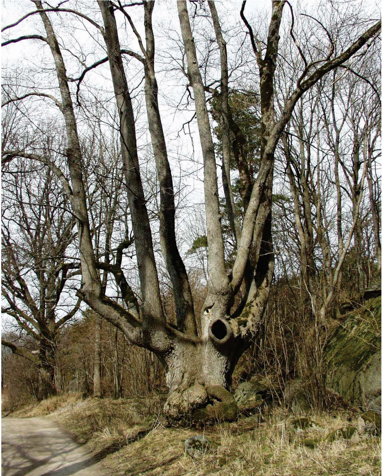
Figur 4 Gammel, hul alm, og en stor eik i bakgrunnen.