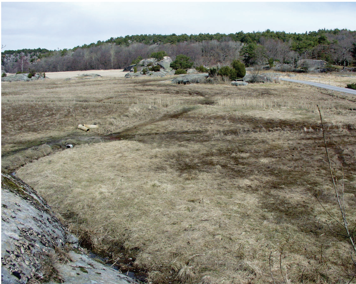
Figur 5 Beitearealer sør for reservatet, løvskoglia i bakgrunnen.

Videre sørover, utenfor reservatet, er det større arealer med strandeng. Strandeng er en naturtype som er avhengig av skjøtsel. Uten skjøtsel (beite eller slått) vil det meste av området gro igjen, takrør vil ta over og på lang sikt vil det vokse opp skog. Av hensyn til landskapet, biologisk mangfold og den historiske bruk av arealene vil det være en fordel med fortsatt beite her slik at de åpne engene opprettholdes.