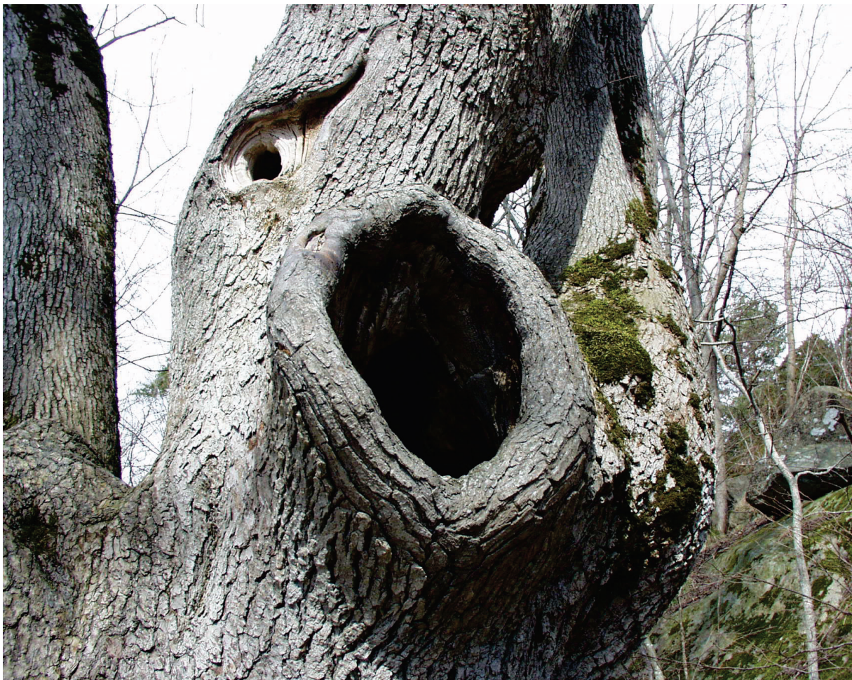
Figur 2 Hule trær er viktig for biologisk mangfold.

Bjørnevågenområdet har store landskapsmessige kvaliteter – det er et vakkert kulturlandskap. Det er et mye brukt turområde, særlig om våren.