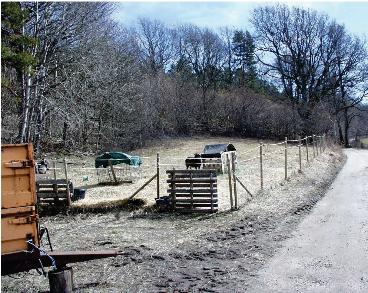
Figur 6 Innhegningen for sau.

Et alternativ til gjengroing med løvskog er å etablere en slåtteeing. Det er sannsynlig at det ganske raskt vil innfinne seg bl.a. en rekke blomsterplanter. For å utvikle og opprettholde en engflora må det etableres et opplegg med slått. Det kan tas standpunkt til spørsmålet om gjengroing til løvskog eller etablering av eng når sauedriften ev. opphører, og saken må avklares med grunneieren.