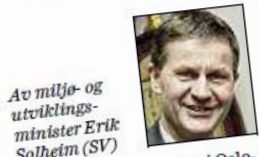
Av miljø- og utviklingsminister Erik Solheim (SV)

Sterkt engasjement og markaloven I strupen på Markaloven