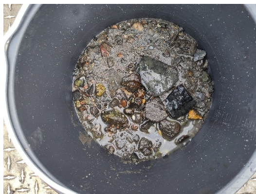
Figur 2: Bilde fra prøvepunkt 702, typiske toppsedimenter for hele området. Sand i ulike fraksjoner og større stein. Stor stein er plukket ut fra prøven som er sendt til lab.