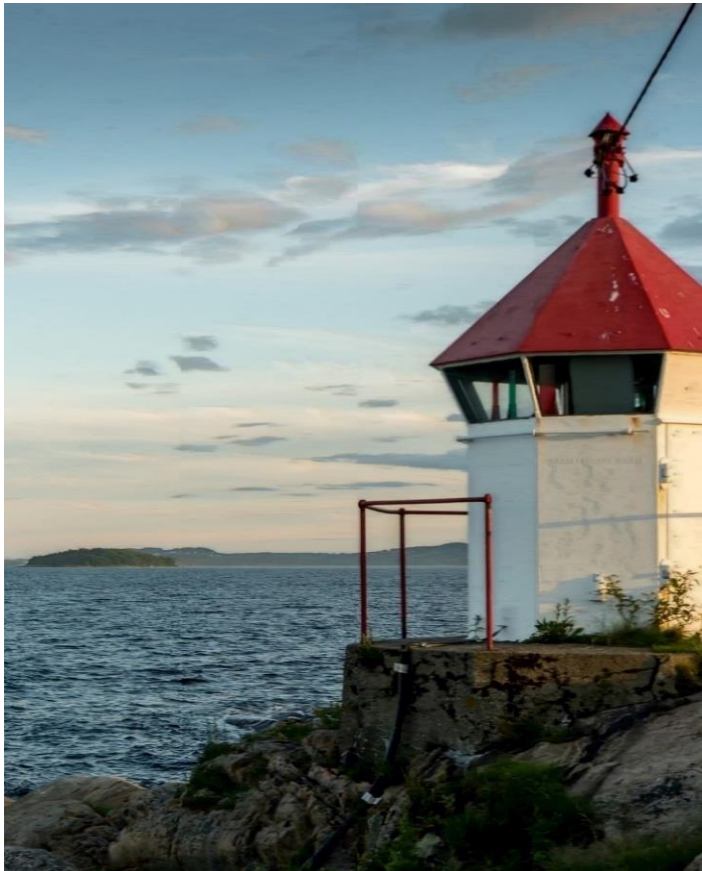
Foto: Fyret på Tofte