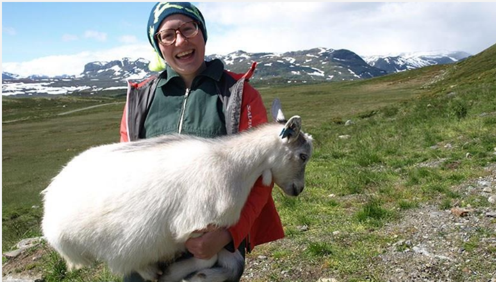
Ung fjellbonde i Vats, Ål i Buskerud.