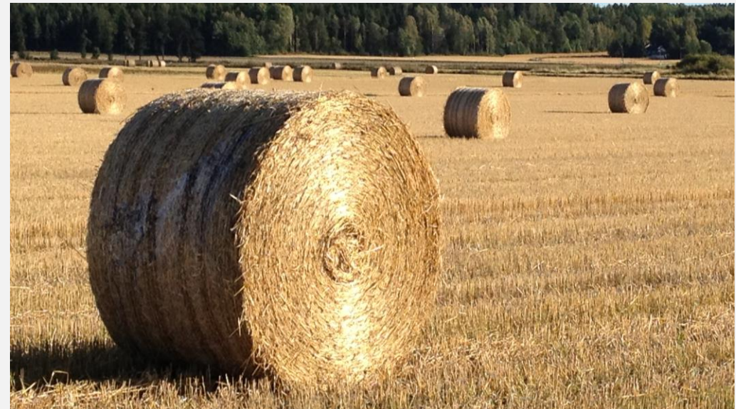
Kornproduksjon i Østfold