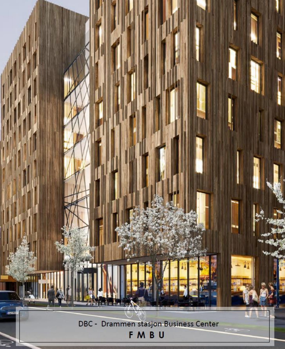
DBC - Drammen stasjon Business Center F M B U