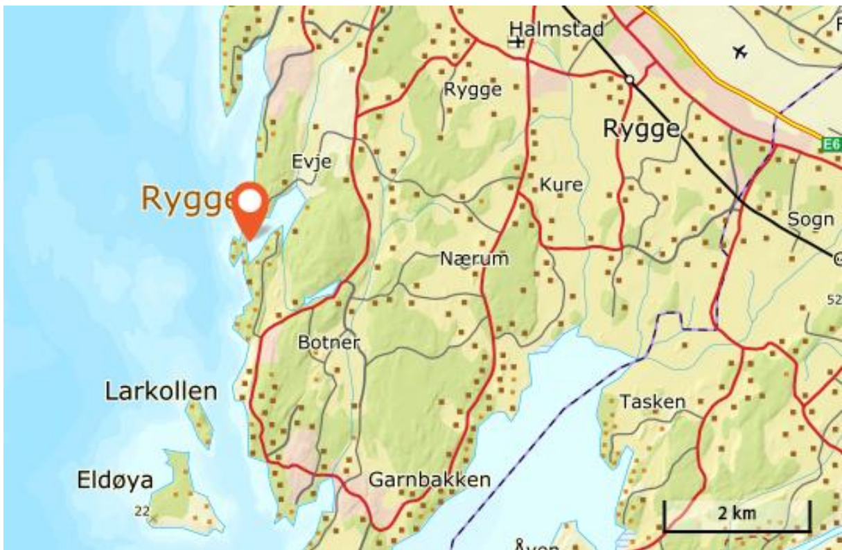
Figur 1. Oversiktskart, Evjebukta – Rygge.

Det er planlagt mudring ved brygge i Evjesundet ved Stangerholmen 43 i Rygge kommune, se figur 1. Viken Sjøtjeneste AS, ved Gøran Grønseth, har tatt ut 1 sedimentprøve i bukta. COWI AS er forespurt om å vurdere prøvene.