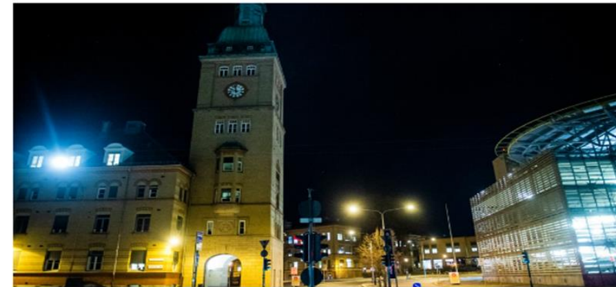
Oslo universitetssjukehus er lokalsjukehus for store delar av Oslo si befolkning. Dei driv mellom anna OUS Ullevål.

Sjukehuset skriv at det er sterkt beklageleg og at slikt ikkje skal skje.