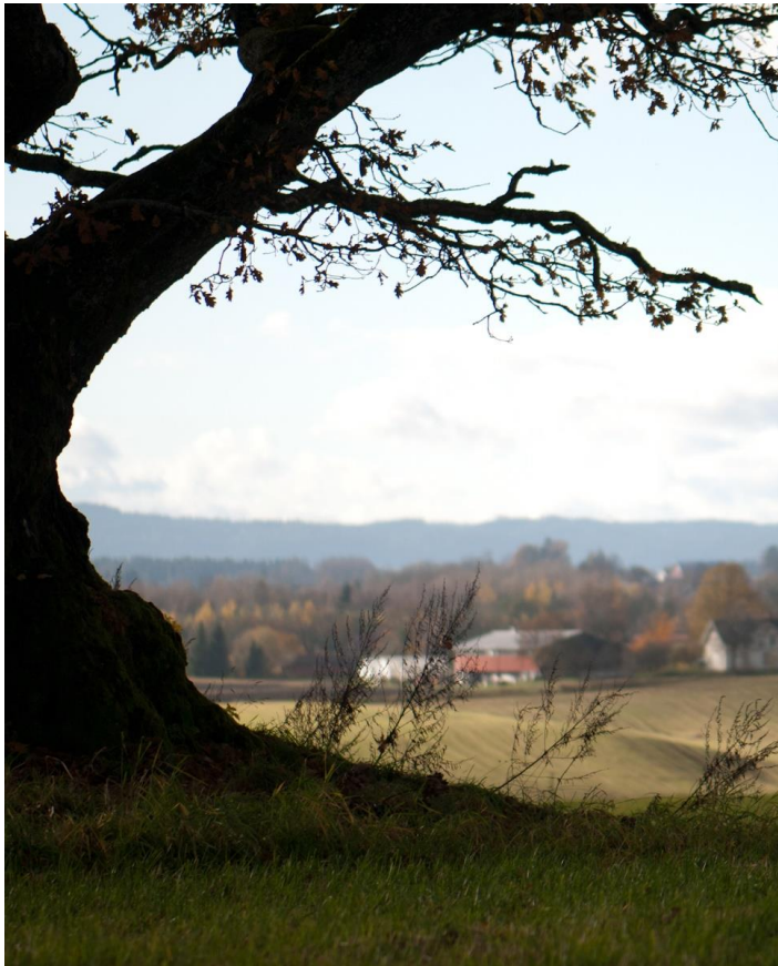
hul eik - Ås

«Fylkesmannen er Kongens og Regjeringens representant i fylket og skal arbeide for at Stortingets og Regjeringens vedtak, mål og retningslinjer kan bli fulgt opp.