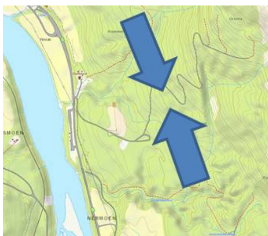
Figur 2 viser hvor det kan flyttes med rein (blå piler) og hvordan flyttleien er innsnevret mellom eksisterende massetak i vest og ur og fjellside i øst.

Enhver utvidelse av massetaket østover vil ytterligere innsnevre flyttleia og medføre negative konsekvenser for reindrifta. Fylkesmannen mener imidlertid at med tilstrekkelige avbøtende tiltak, som gjerder og avtaler om stenging av drift under flytting, kan en mindre utvidelse østover gjennomføres. Men, dersom massetaket utvides slik som foreslått, vil det innebære en stenging av flyttleia. Slik planforslaget foreligger, innebærer dette uttak av masser helt opp til ur og fjellside, jf figur 3.