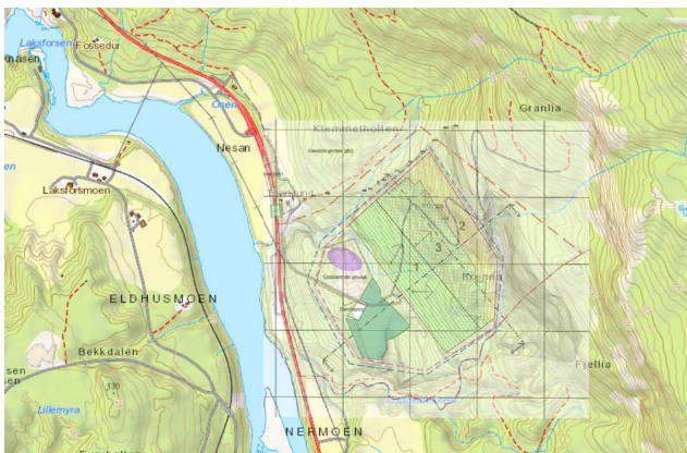
Figur 3. Georeferert plankart med foreslått etappevis utbygging (georeferert av Fylkesmannen).

Enhver utvidelse av massetaket østover vil ytterligere innsnevre flyttleia og medføre negative konsekvenser for reindrifta. Fylkesmannen mener imidlertid at med tilstrekkelige avbøtende tiltak, som gjerder og avtaler om stenging av drift under flytting, kan en mindre utvidelse østover gjennomføres. Men, dersom massetaket utvides slik som foreslått, vil det innebære en stenging av flyttleia. Slik planforslaget foreligger, innebærer dette uttak av masser helt opp til ur og fjellside, jf figur 3.