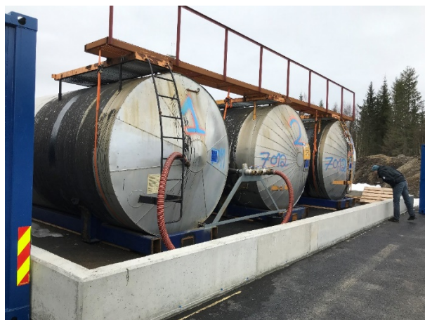
Bilde 1 Tanklagring av farlig avfall

Under tilsynet fikk vi en gjennomgang av risikovurderingen til tankanlegget på Langvassheia. Her har dere identifisert flere hendelser som kan gi forurensning, for eksempel overfylling og slangebrudd. Dere viser også til at det er iverksatt tiltak for å redusere risikoen, blant annet med ringmur rundt tankanlegget og asfaltert flate utenfor denne (se bilde 1). Risikoanalysen gir samtidig ingen vurdering av sårbarheten til miljøet som kan bli berørt av en eventuell hendelse med oljeutslipp (se kart på bilde 2). Vi kunne heller ikke finne noen slik vurdering i søknad om tillatelse til etableringen av dette avfallsanlegget.