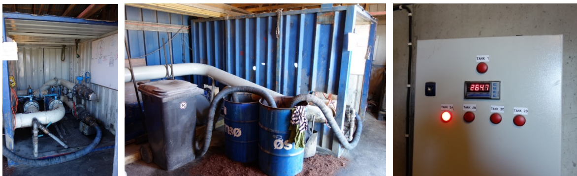
Bilde 1 – 3, påkobling under fylling og tømning av tankanlegget og alarm mot overfylling

Under tilsynet fikk vi en gjennomgang av risikovurderingen til tankanlegget på Vikan. Her har dere identifisert flere hendelser som kan gi forurensning, for eksempel overfylling og slangebrudd. Dere viser også til at det er iverksatt tiltak for å redusere risikoen, blant annet med overfyllingsvern og betongplate med kobling til oljeutskiller i det området som er i bruk under fylling og tømning av tankanlegget (se bilde 1 - 3). Risikoanalysen gir samtidig ingen vurdering av sårbarheten til miljøet som kan bli berørt av en eventuell hendelse med oljeutslipp (se bilde 4 og 5).