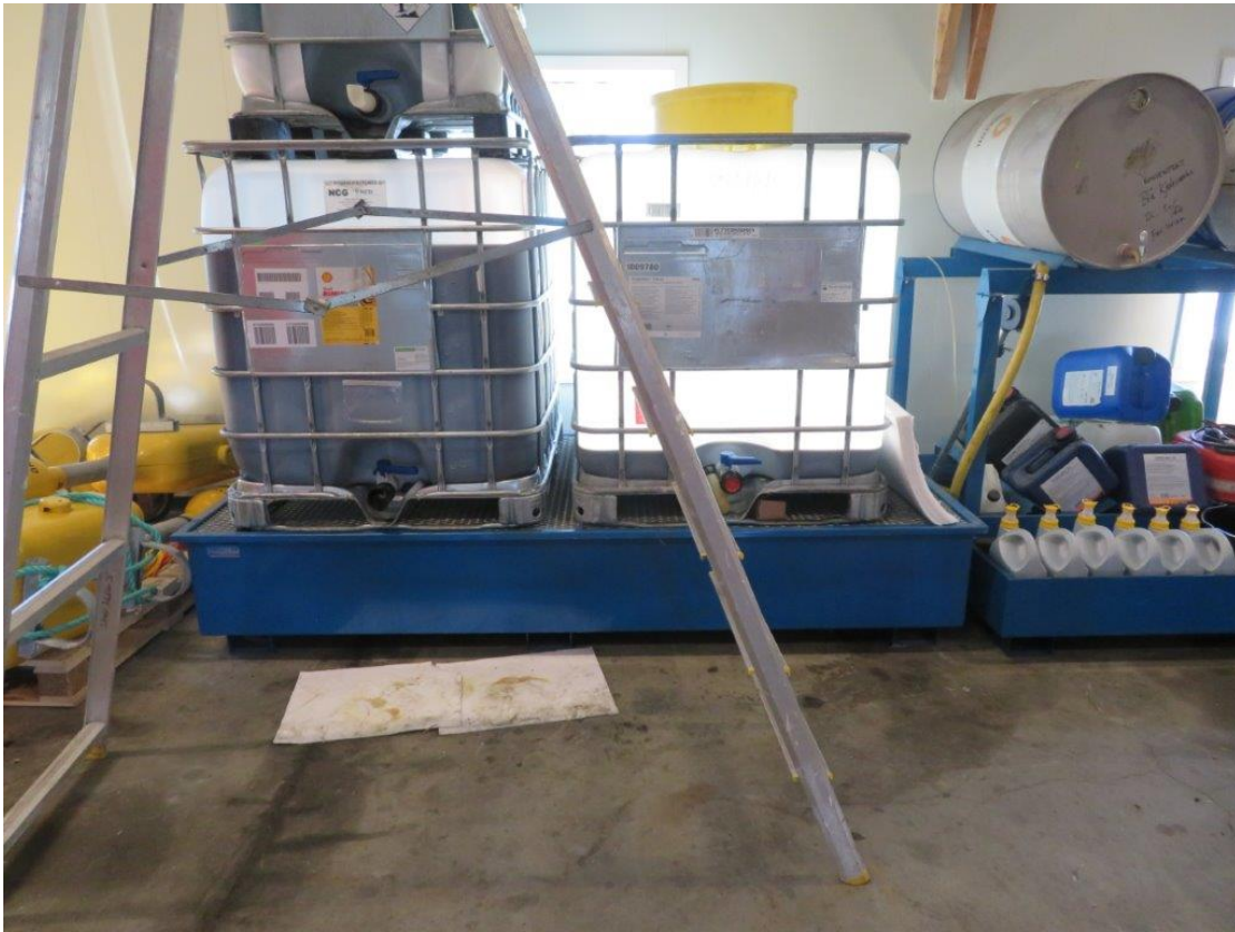
Figur 3. Oppbevaring av oljeprodukt (IBC-kontainer til venstre) og spillolje (IBC-kontainer til høyre).