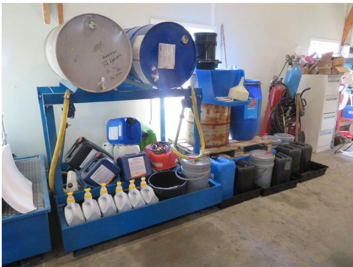
Figur 5. ESF sin oppbevaring av farlig avfall (blå dunk markert med «oljefilter» til høyre i bildet).