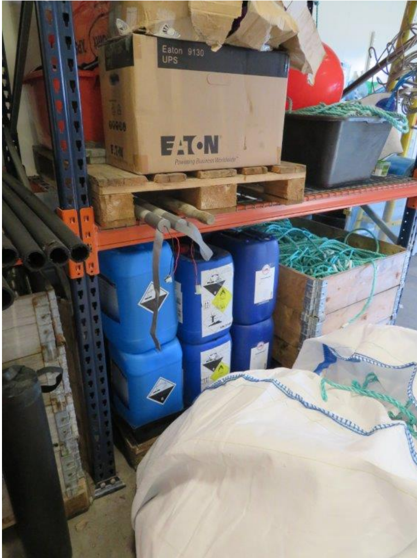
Figur 4. Dunker med vaskemiddel står oppi en spillbakke (synlig mellom pale på gulv og blå dunker) som i utgangspunktet tar 40 liter.