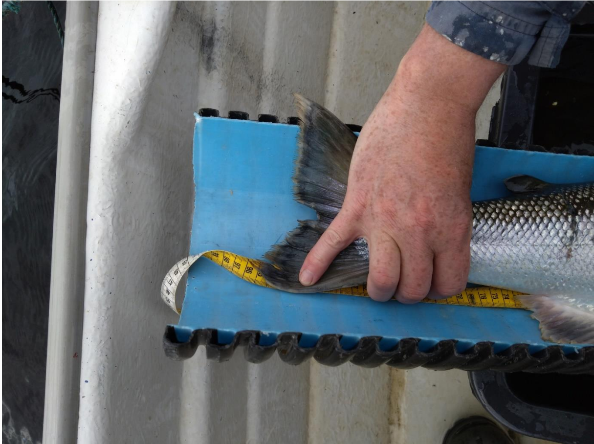
Det var noen veldig store eksemplarer av laks i rusa