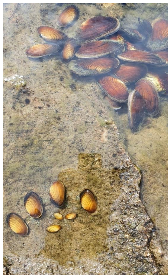
Rekrutter og eldre i Valneselva, Bodø