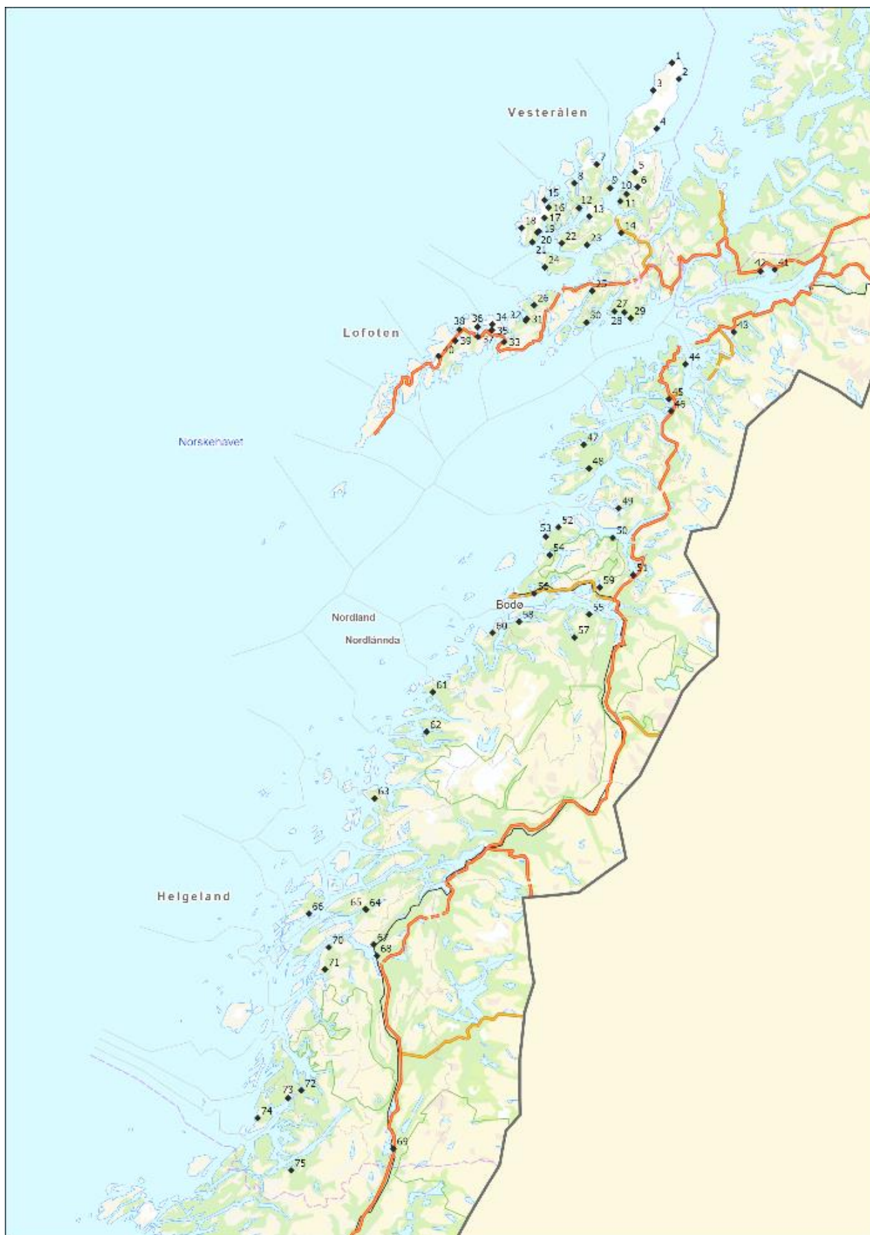
Fordeling av vassdrag med muslinger i fylket