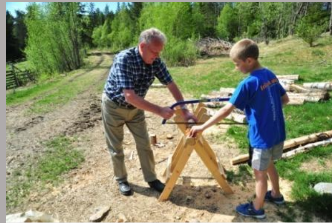
Inn på tunet – Aktivitetstilbud i gårdsmiljø

Hva tenker du vil være et godt øyeblikk for deg?