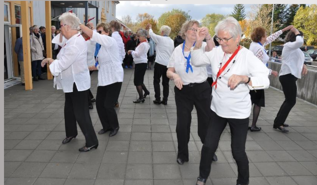
Åpningen av det nye Leknes bo- og servicesenter. Underholdning av gruppen Seniordans.