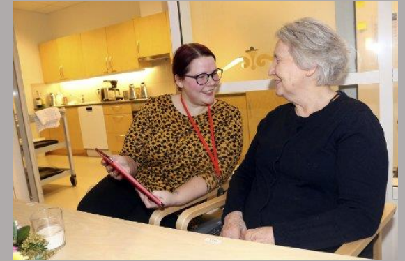
Min Memoria på Fredlundskogen i Vefsn kommune Helg.no