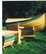
En bar utformet som en Nordlandsbåt.

Nordlandsbåtenes klassiske linjer til sitt eget møbeldesign. Hovedproduktene er båtstoler tilknyttet barmøblement, og produktene leveres ferdig utsmykket og malt fra Bjerkli Båt. Under produksjonen benyttes den samme fremgangsmåte som ved bygging av tradisjonelle Nordlandsbåter.