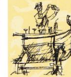
En bar utformet som en Nordlandsbåt.