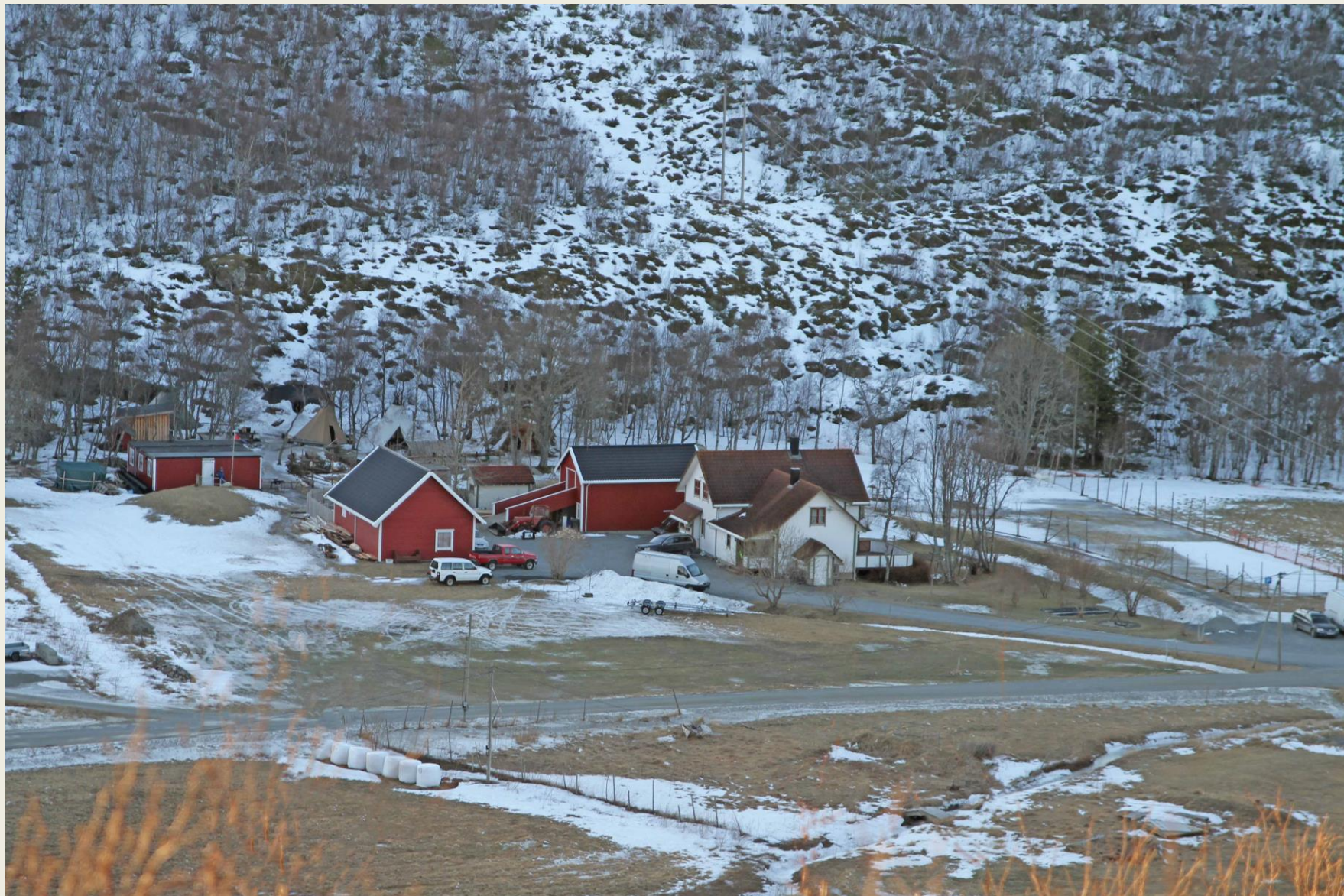
Gården i Ersvika