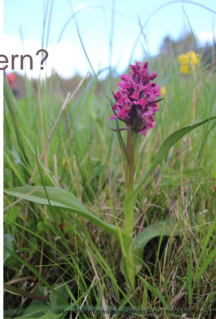
Vårmariland Orchis mascula